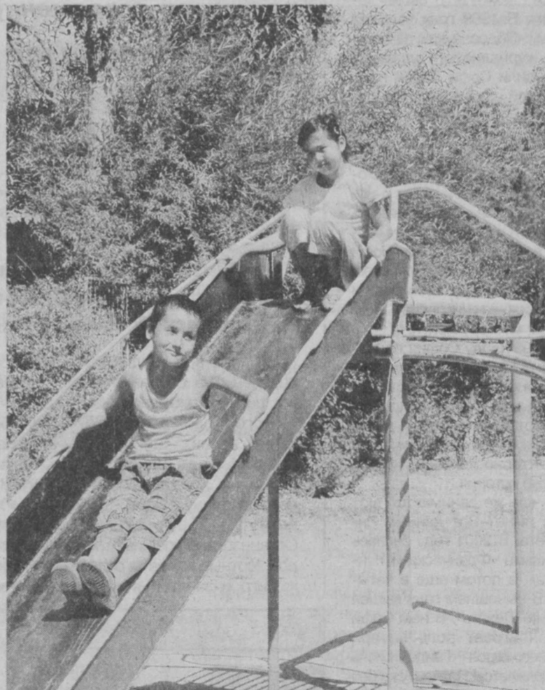
Весело ребятам на детской площадке ширката.