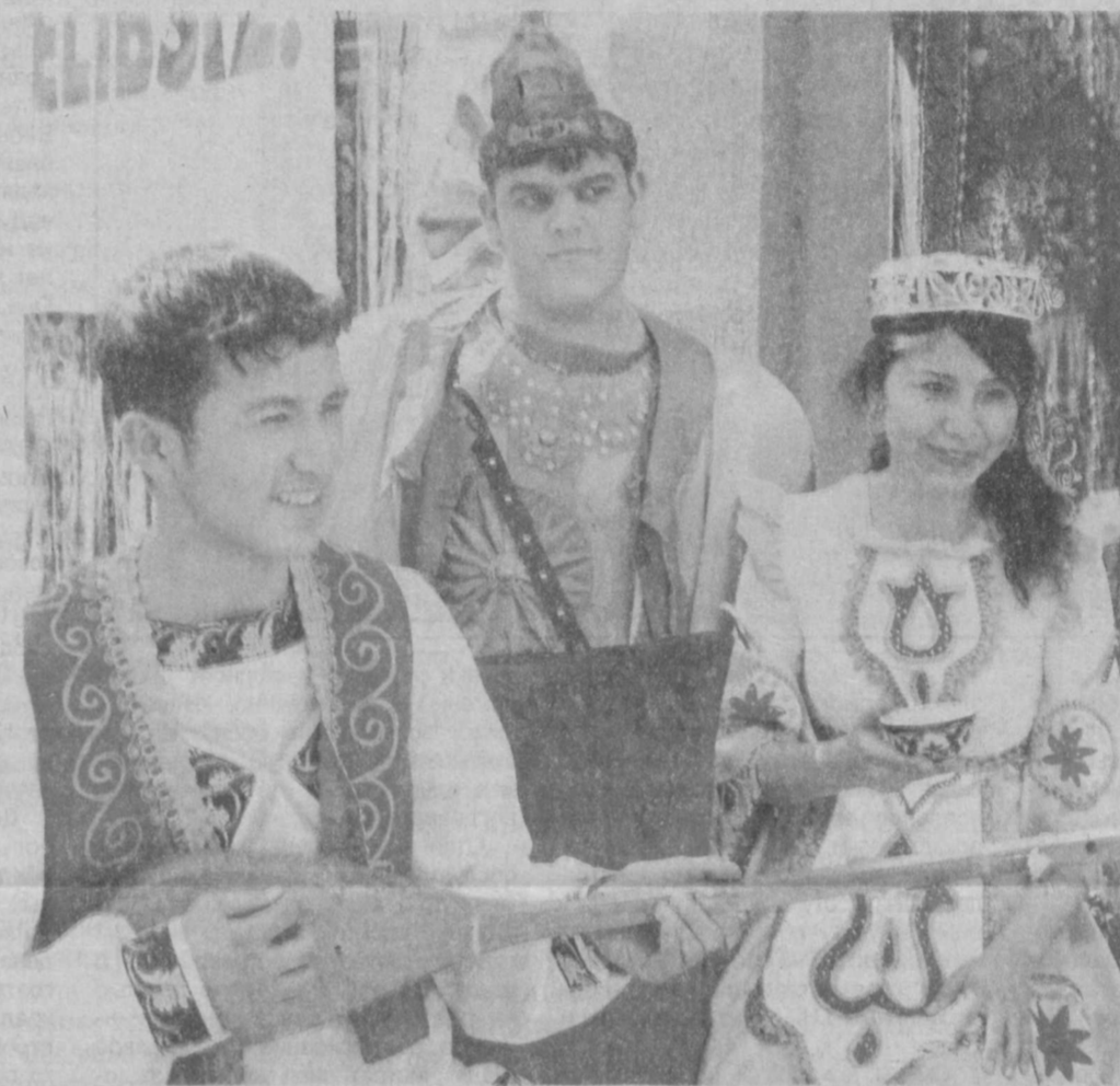
Сохраняя традиции народного творчества, мы развиваем современную культуру.