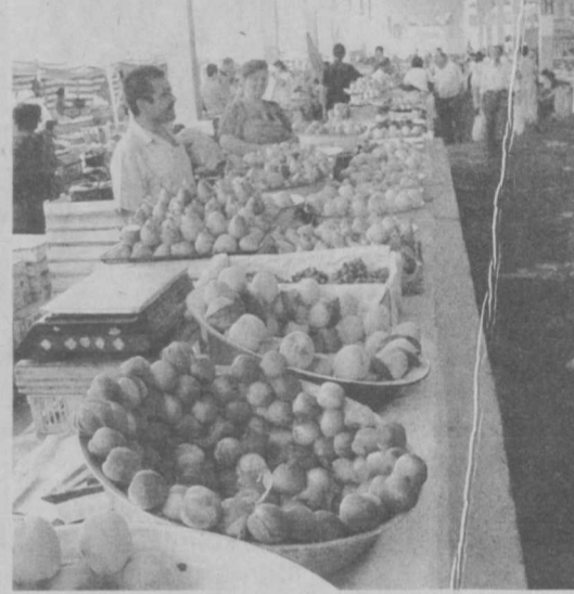
Как вас обслуживают?