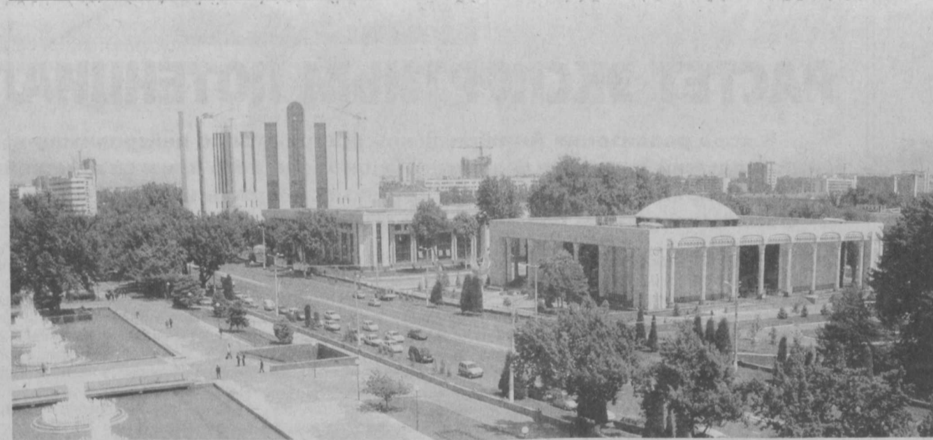
Здания современной архитектуры, фонтаны, зеленые тенистые скверы — украшение столицы.

Повышается уровень конкурентоспособности не только изготовленной у нас продукции, но и услуг, в том числе в области обучения.