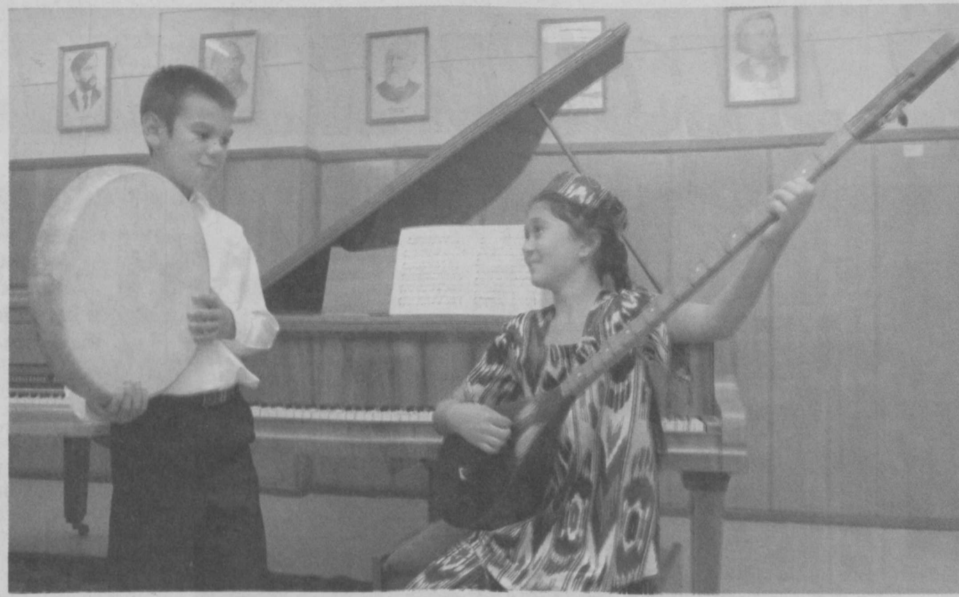
Музыка делает нас духовно богаче.