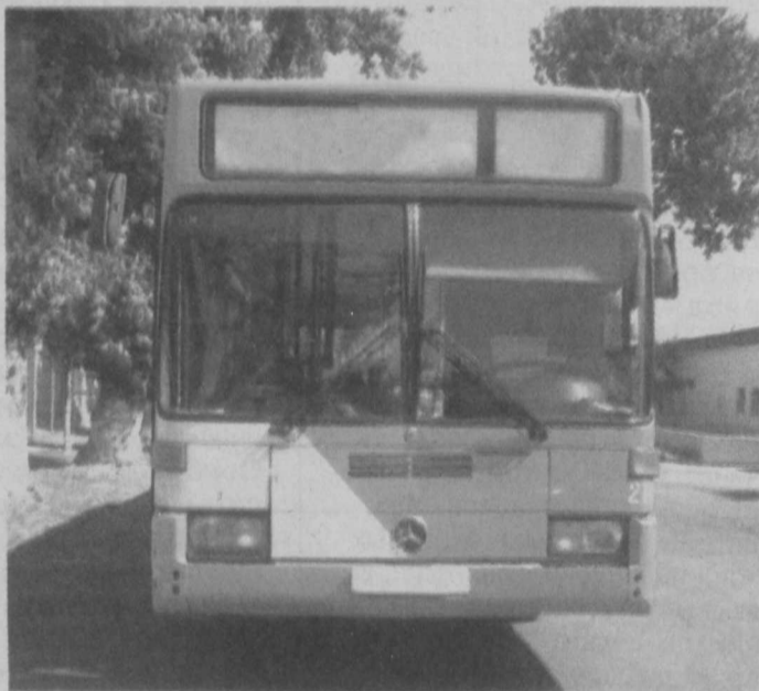
товая цена - 29 000 000 сумов, сумма заклада 5 800 000 сумов;