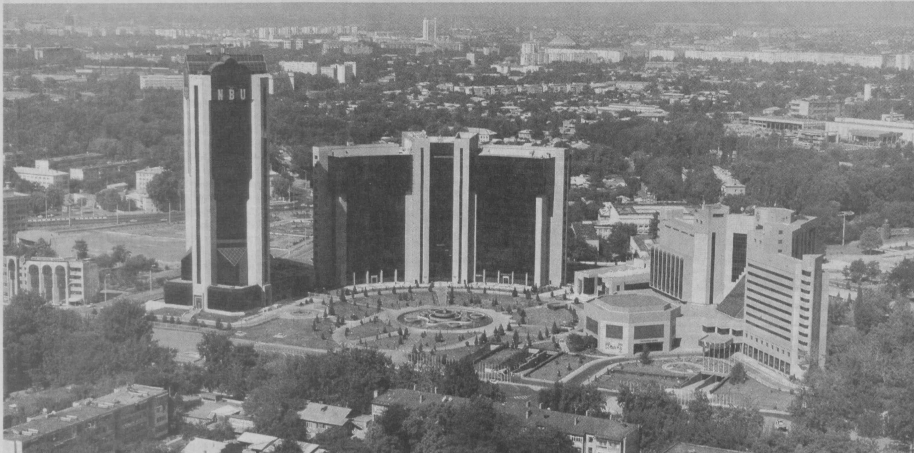
За годы независимости наша столица превратилась в один из современных городов мира.

В столичном парке культуры и отдыха имени Г. Гуляма состоялся творческий вечер, посвященный народному артисту Узбекистана Юнусу Раджабий. Прозвучал концерт с участием представителей его династии.