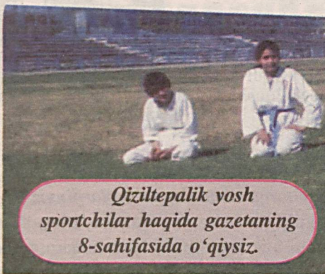
Qiziltepalik yosh sportchilar haqida gazetaning 8-sahifasida o'qiysiz.