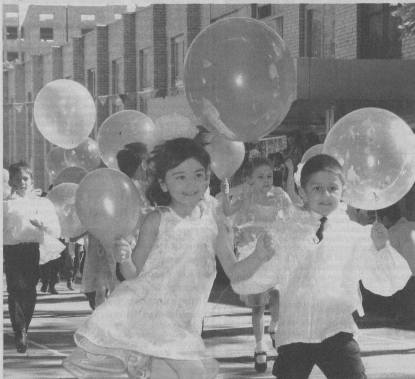
Это наше будущее. Наша надежда...