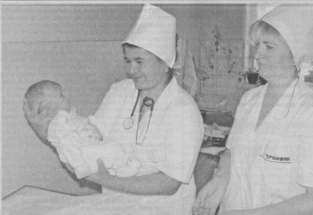
Защита здоровья детей — приоритет социальной политики нашего независимого государства.