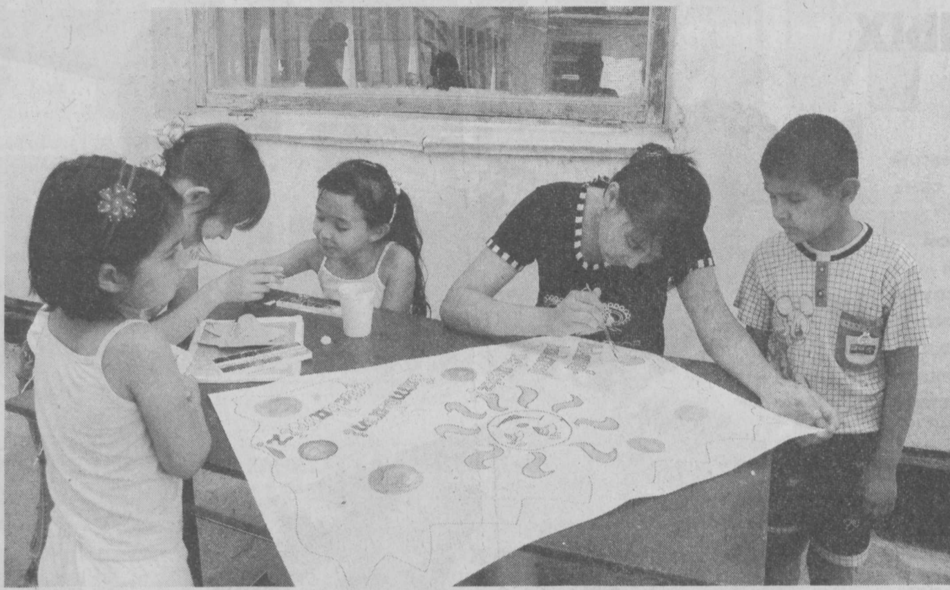
Навыки рисования прививаются с детства.