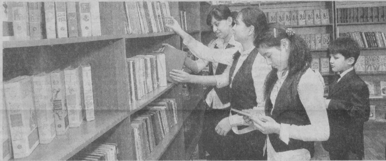
В информационно-ресурсном центре.