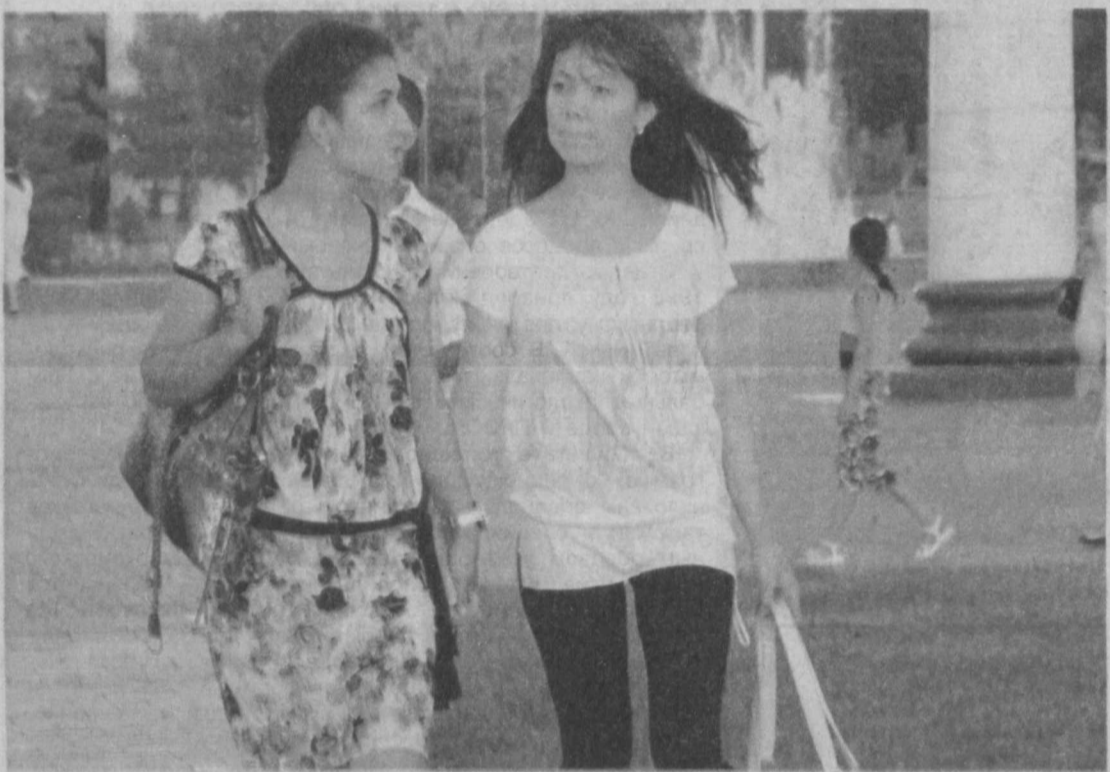
Молодежь – наше будущее.