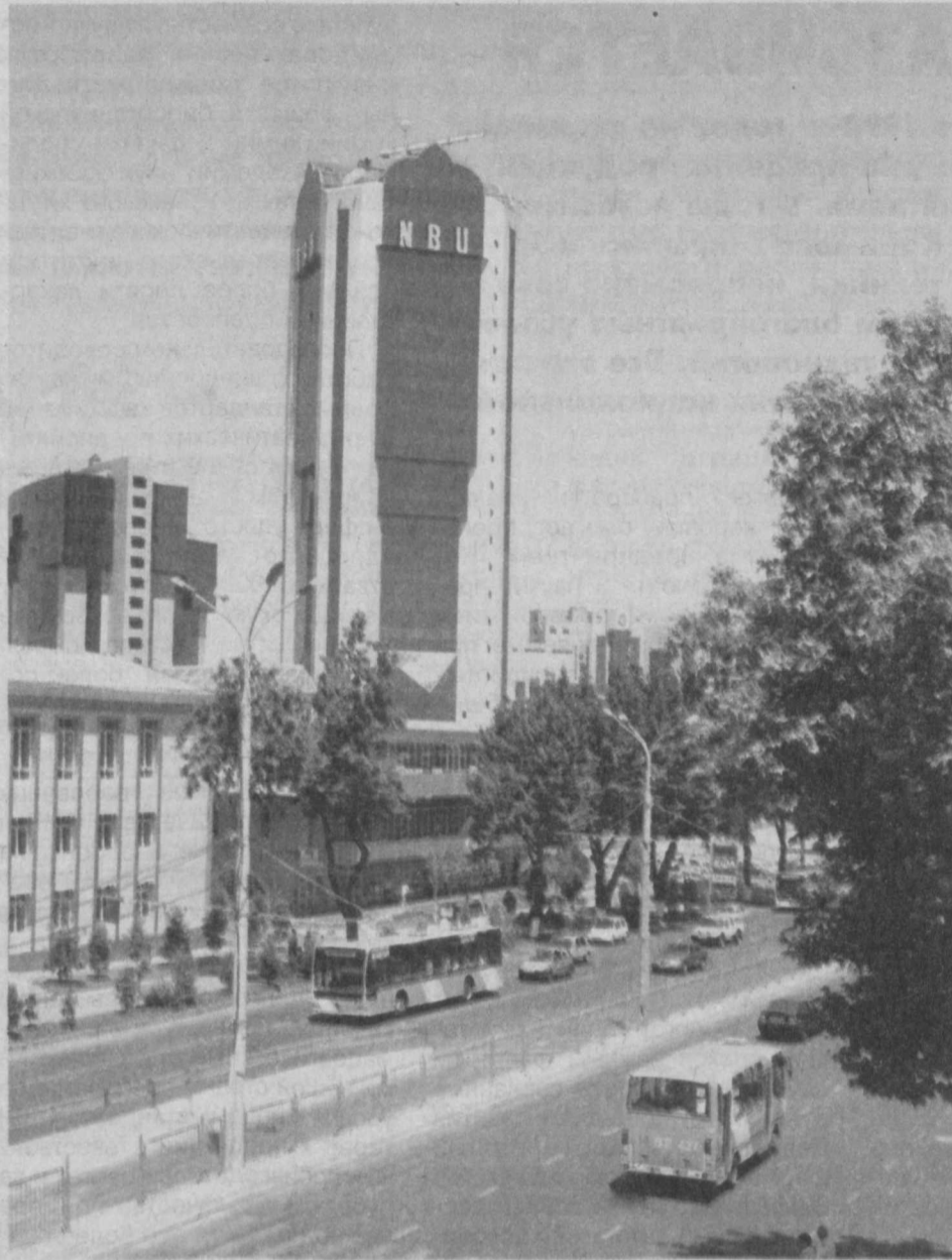
Приметы нового времени.