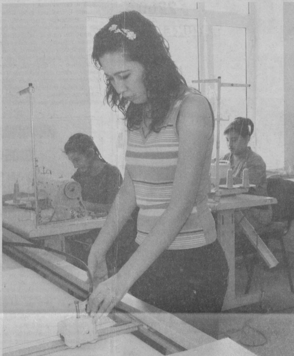
ООО «Бека Текстиль» выпускает трикотажные ткани, а также широкий ассортимент готовой мужской, женской и детской одежды. За счет наращивания производственных мощностей в этом году на предприятии было создано 20 новых рабочих мест.