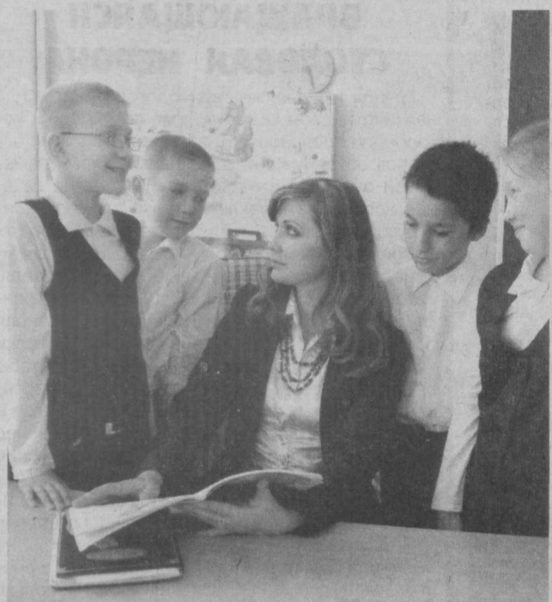
Есть что обсудить с любимой учительницей...