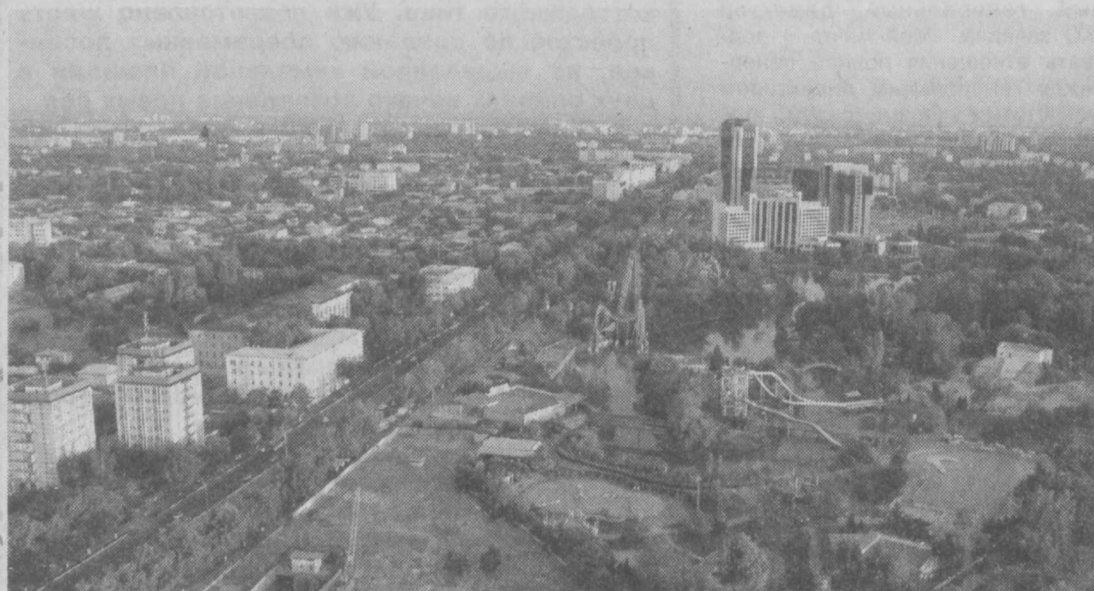
Мой любимый город.