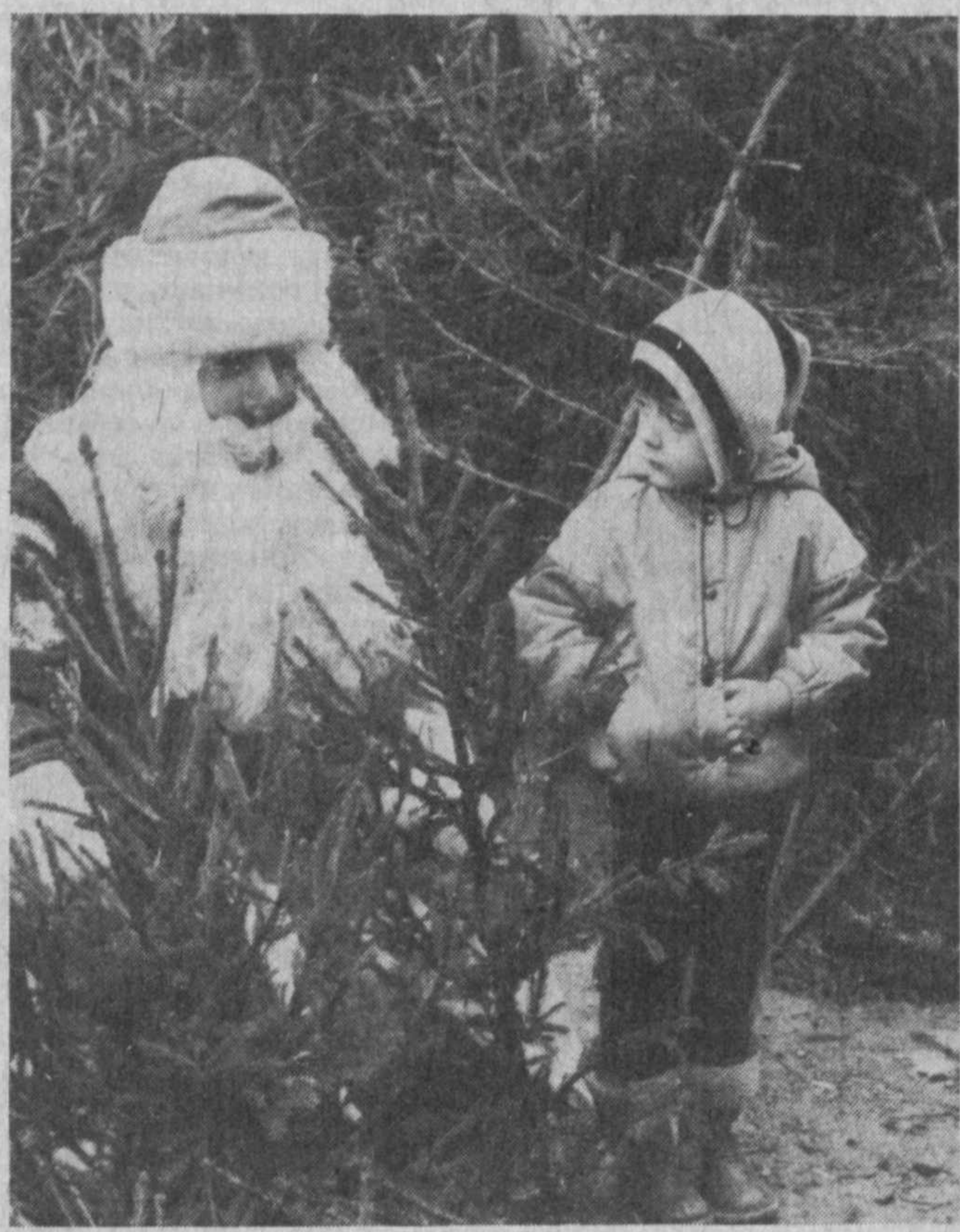
Здравствуй, Дедушка Мороз.