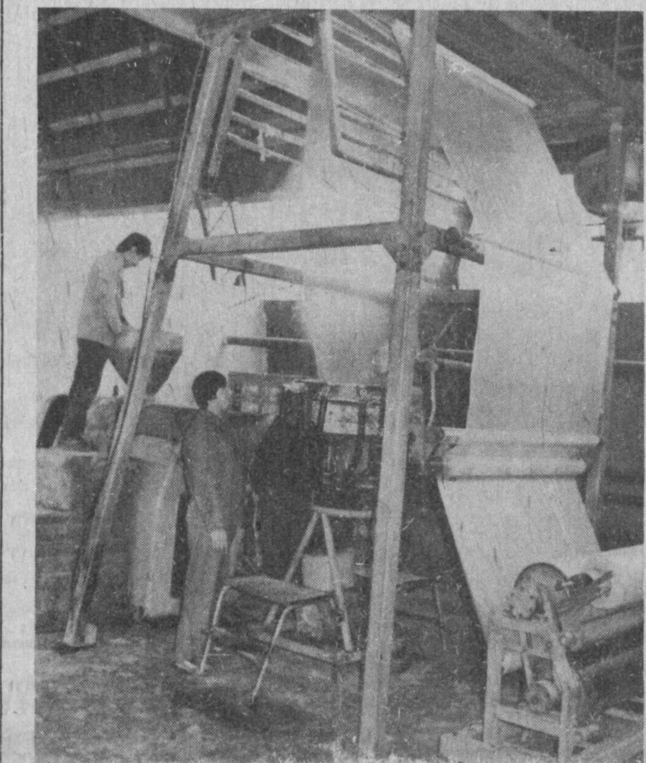
Трубы различных диаметров, полиэтиленовую пленку, тару для сельскохозяйственных кормов и сенажа и другую необходимую для производства продукции изготавливают на предприятии из вторичных полимеров.