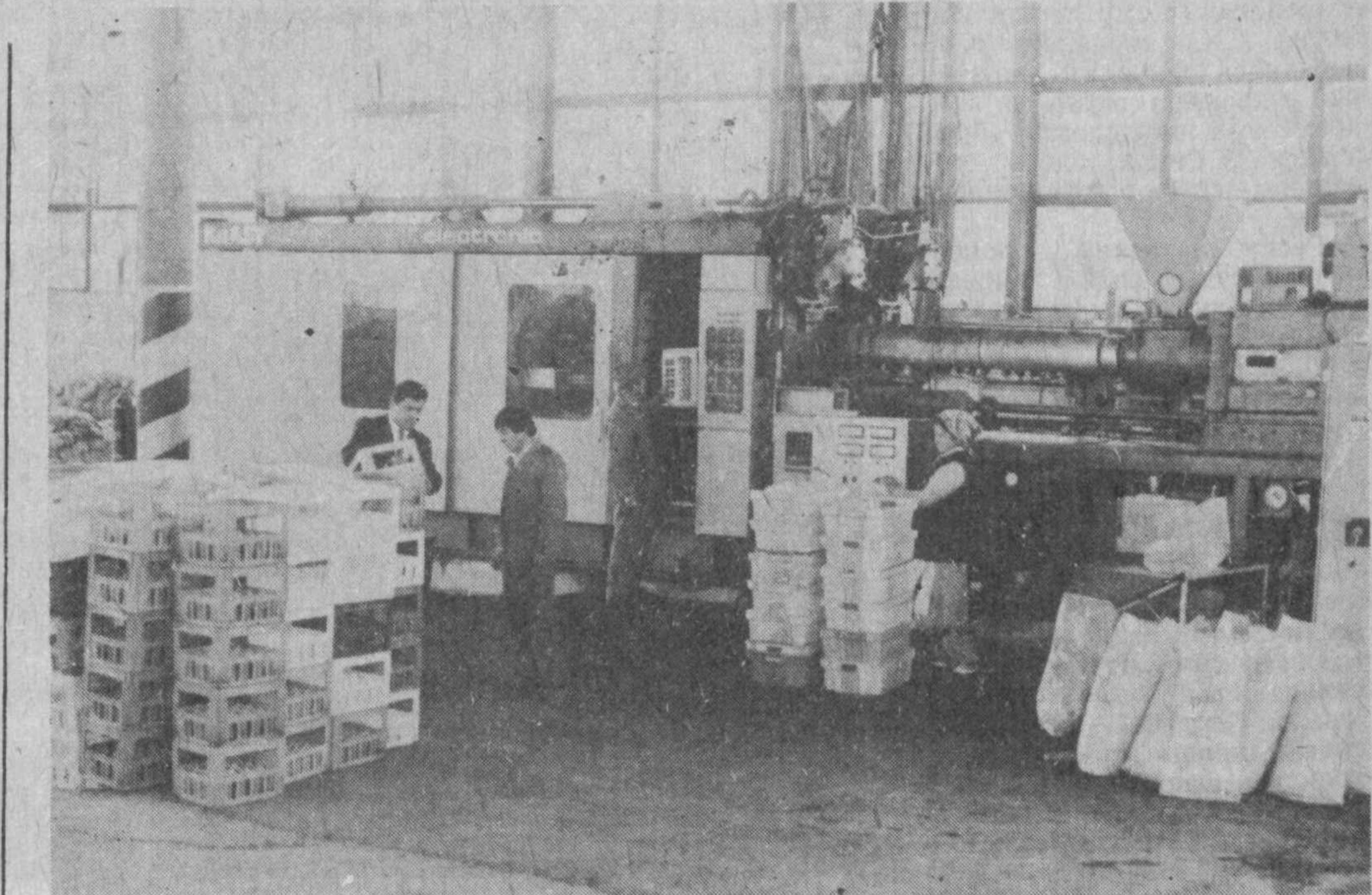
В два раза увеличили объем производства труженики янгиельского арендного производственного кооператива «Труда».

На страницах «Деловой жизни» представлено много места фотоснимкам о жизни Республики Узбекистан. В заключение хотелось бы подчеркнуть, что прогрессивные мыслители признают правильность внутренней и внешней политики руководства Узбекистана. Об этом свидетельствуют 13—14 номера за 1992 год журнала «Деловая жизнь».