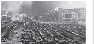
автомобилларга жиддий зарар етган.

Оқибатда 44 киши ҳаётдан кўз юмди, қарийб беш юз нафарга яқин одам тан жароҳати олди. Улардан ўн икки нафари воқеадан сўнг содир бўлган ёнгини бартараф этишга жалб қилинган ўт ўчириш хизмати ходимлари эканини айтилмоқда. Бундан ташқари, 36 нафар ўт ўчирувчи бедарак йўқолган.