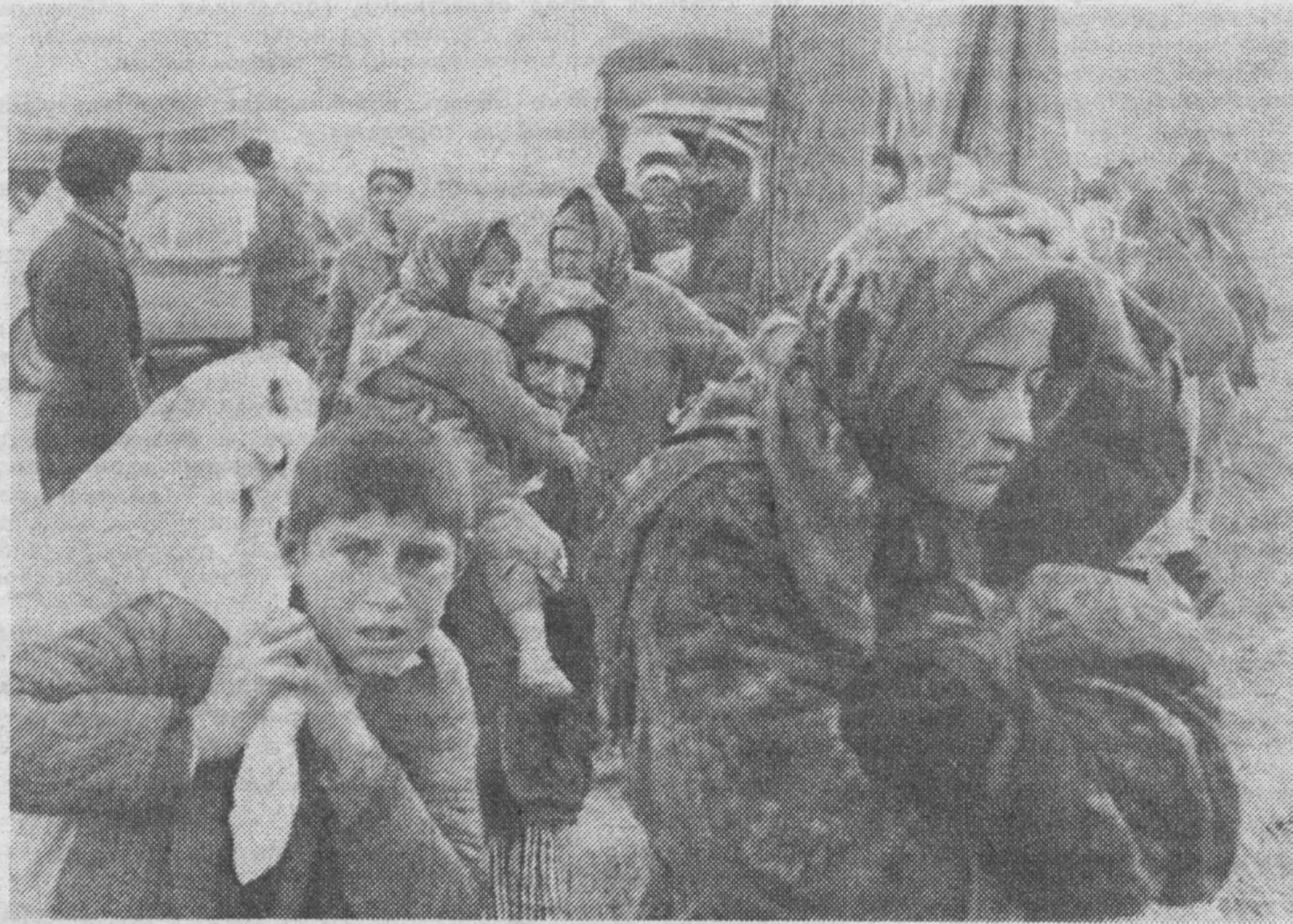
● Гражданская война в Таджикистане близится к завершению, беженцы возвращаются к родным очагам.

ких километрах отсюда, тут же в окрестностях Курган-Тюбе, где уничтожено все или почти все, сохранился оазис, вовсе не тронутый войной. Мы на участке Гулисур совхоза «Новобакор» Бохтарского района. Здесь проживают 3.500 таджиков гармского происхождения, традиция, онно отличавшихся глубокой религиозностью. По всем предположениям, они должны были поддержать бесчинствующих поблизости исламистов. Но... получилось иначе.