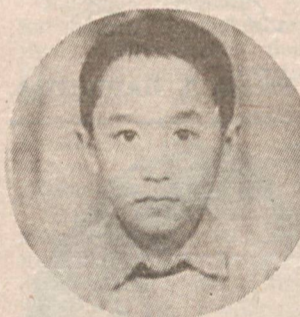
Сурхондарё вилояти, Шўрчи шаҳри, Шўрчи дон маҳсулотлари комбинати посёлкаси.

9 ёшинг муборак бўлсин. Барча орзу ниятларинг ҳақиқатга айланишига тилаймиз. ҚОРАБЕКОВ лар оиласи.