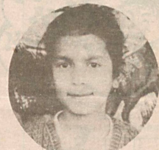
Навоий вилояти, Қизилтепа тумани, Бўстон давлат ҳўжалиги.