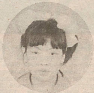
Тошкент вилояти, Бекобод тумани.

Сени барча оила аъзоларимиз қўшув айёминг билан чин қалбдан табриклаймиз. Ўқишларинг ҳар доимгидек аъло бўлсин. Ўйлаган барча орзуларинг ушалишига тилакдошимиз. ҲАМДАМОВ лар оиласи.