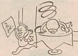
Рассом Д. ПАРПИЕВА.

— Сизнинг ҳинд мусиқаси ва қўшиқларига, умуман, шу мамлакатга бўлган муҳаббатингиз қачондан бошланган?