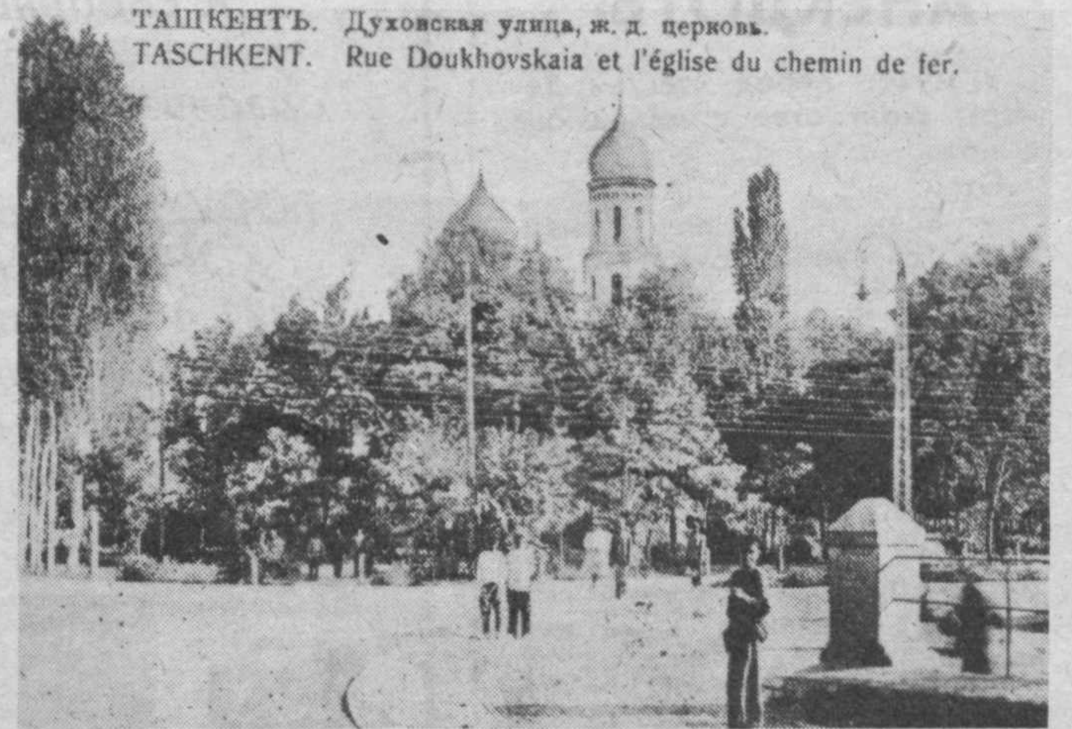
ТАШКЕНТ. Духовская улица, ж. д. церковь. TASHKENT. Rue Doukhovskaia et l'église du chemin de fer.