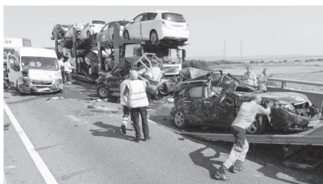
Хориж матбуоти хабарлари асосида тайёрланди.

Ўнлаб одамлар жароҳатланди, саккиз кишининг ахволи оғир экани айтилмоқда. Йўл транспорти ҳодисаси Шеппи ороли билан Кент графлигини боғловчи кўприк устида рўй берган. Мазкур ҳудудда ҳаракат вақтинча тўхтатилди. Гувоҳлардан бирининг айтишича, ноқулай об-ҳаво шароити бўлишига қарамай, аксарият ҳайдовчилар туманга қарши чироклардан фойдаланишмаган. Натижада мана шундай кўнгил-сизлик келиб чиққан.