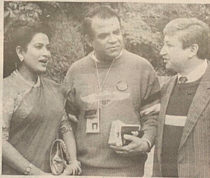
Суратда: фестиваль иштирокчилари қизгин суҳбатлашишмоқда.

— Жаннатмакон ўлкада яшар экансизлар, — дея хайрлашаётган анжуман иштирокчилари ҳам, мезбонлар ҳам мазкур тадбир уфқи янада кенгайиб, умумжаҳон тусини олажагига умид боғладилар.