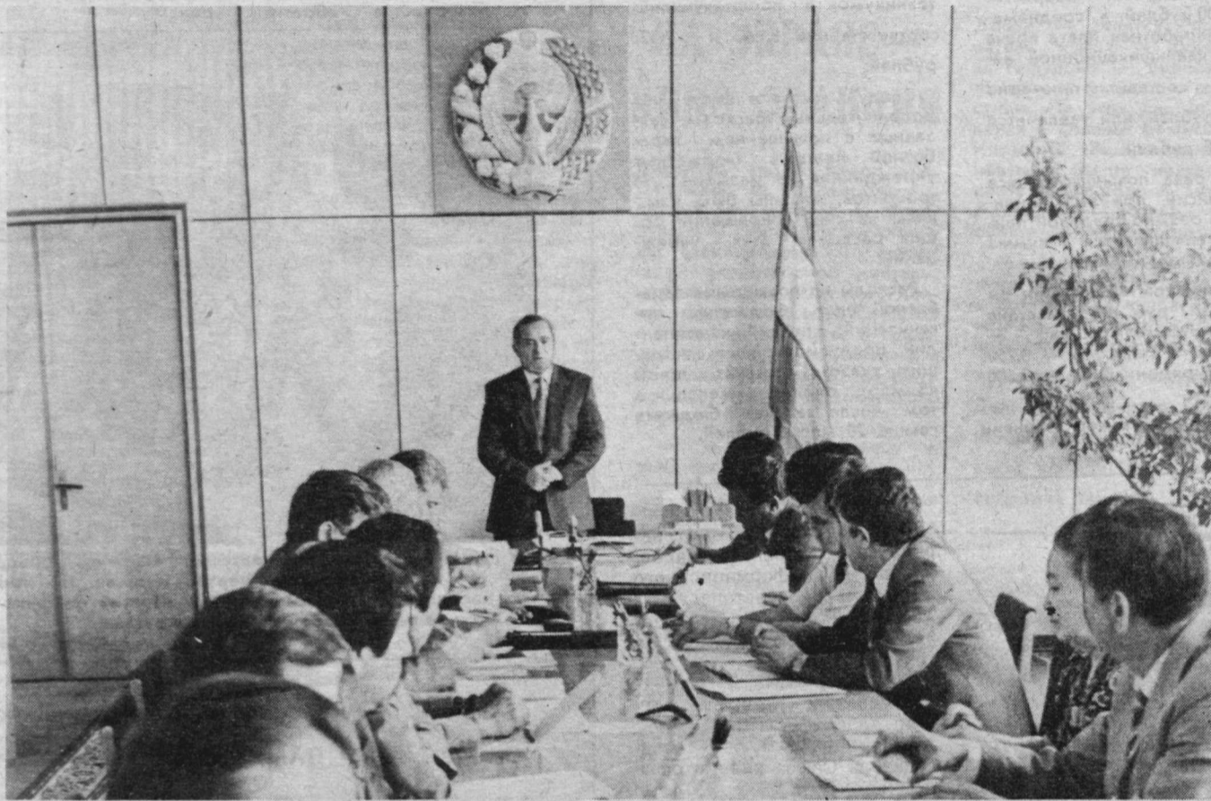
На снимке: во время встречи.