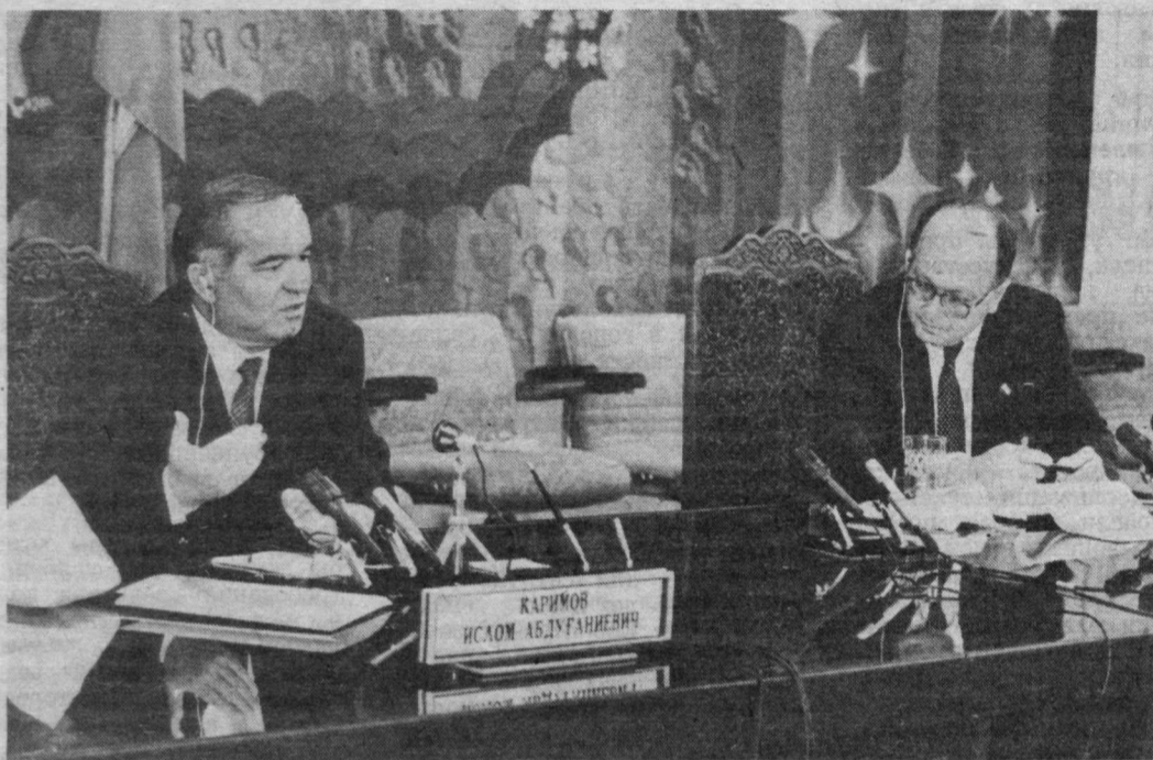
Президент Республики Узбекистан Ислам Каримов и вице-президент Европейского банка развития и реконструкции (ЕБРР) Рональд Фриман провели пресс-конференцию и ответили на вопросы журналистов.

1993 СЕНТЯБРЬ 9 ЧЕТВЕРГ № 104 (9918) В розницу — свободная цена