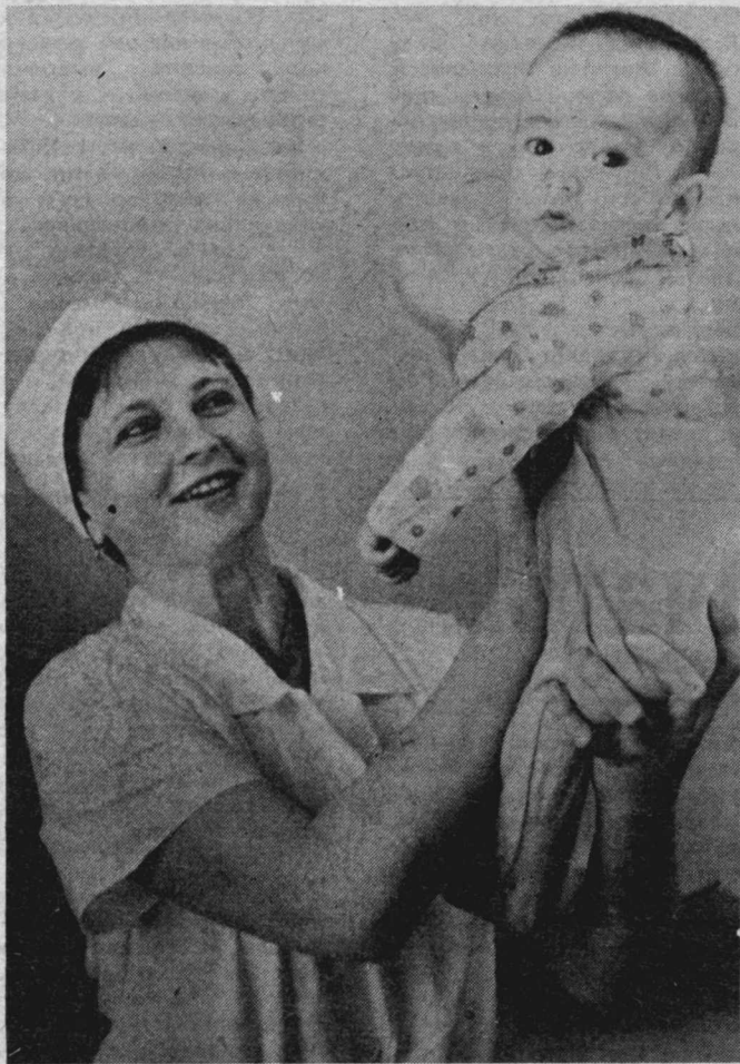
Вот такой красавчик!