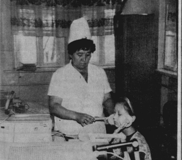
На снимках: студенты, будущие текстильщики, во время практики на комбинате знакомятся с его деятельностью (вверху); в медсанчасти комбината лечатся не только работники объединения, но и их дети.