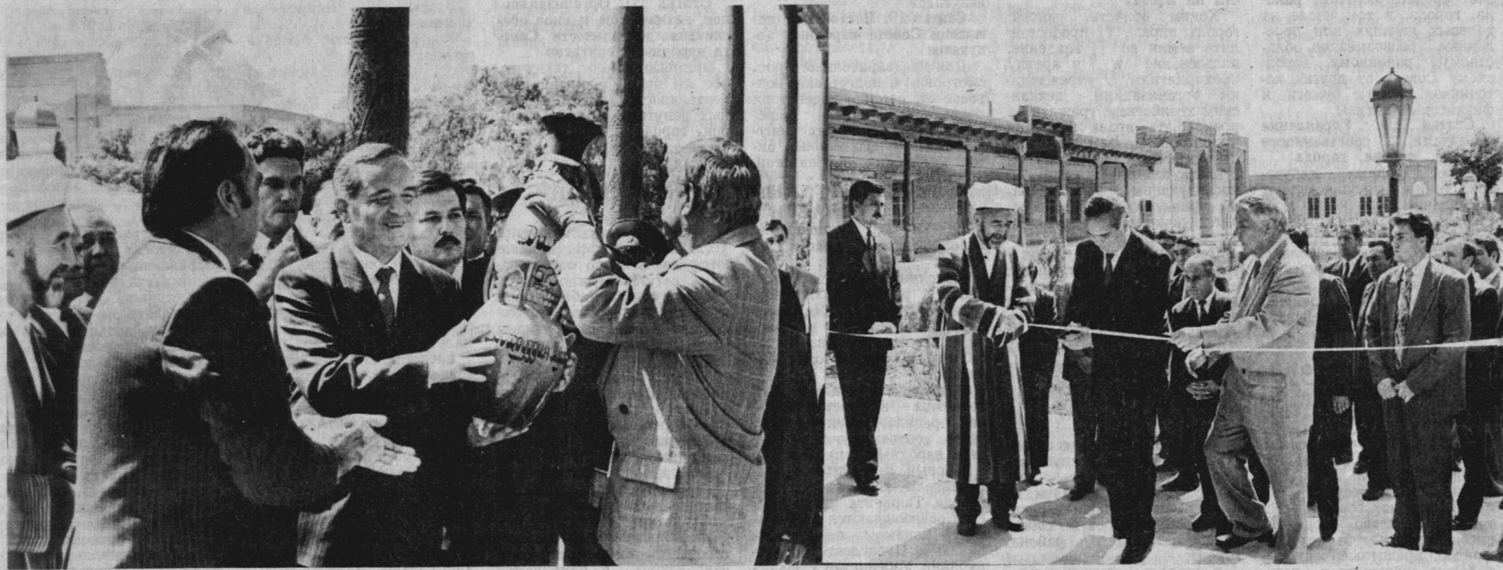
В этом году во всем мусульманском мире широко отмечается 675-летие Бахоуддина Накшбанди. В древней Бухаре, где он родился, состоялись торжества, в которых принял участие глава нашего государства Президент Ислам Каримов.

ракалпакстан, хокимиятам областей и г. Ташкента обеспечить безусловное выполнение настоящего распоряжения. 3. Минфин Республики Узбекистан совместно с ассоциацией «Узбексавдо» и Узбекбюро внести необходимые изменения в объемы размеров дотации из бюджета на указанные цели. Президент Республики Узбекистан И. КАРИМОВ. г. Ташкент, 18 сентября 1993 г.