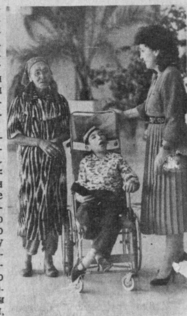
организаторами проведенной благотворительной акции? Сострадание — да, милосердие — да, но, вероятно, прежде всего было искреннее желание помочь, подарить детям хоть немного душевной теплоты и хорошего настроения.

Да, действительно, все было, как говорится, на уровне. Тем более что пос-