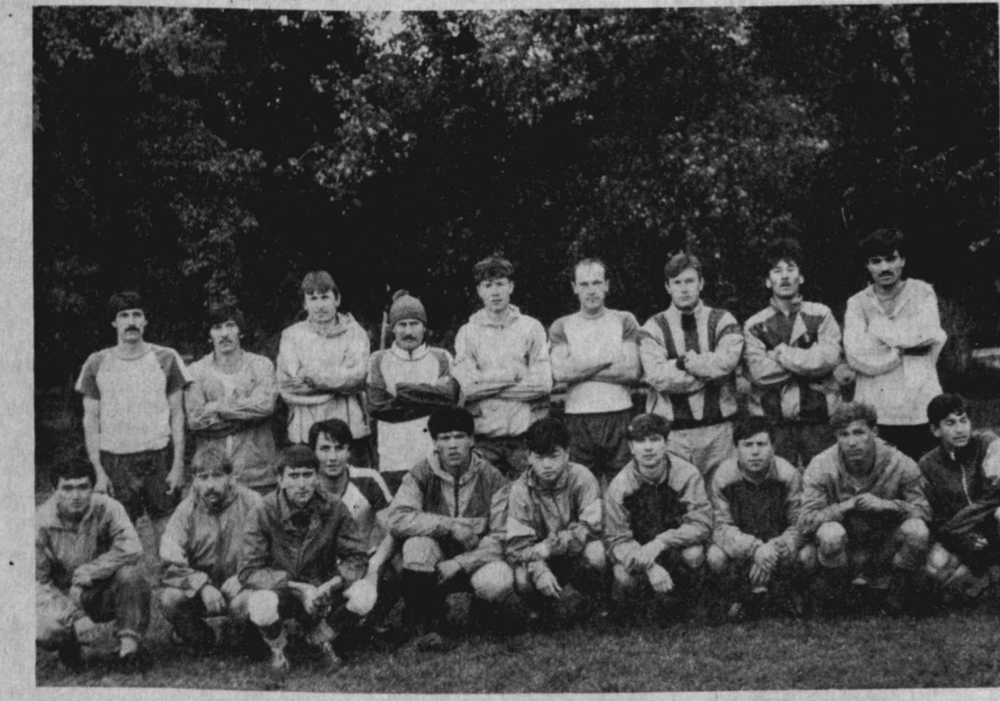
Итак, чемпион Ташкентской области определен. Это команда «Мельбич» из Янгйуля.

С 20 же сентября началось первенство Республики Узбекистан среди команд второй лиги. В нем примут участие победители областей Каракалпакстана и Ташкента.