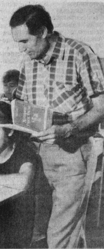
В городе Газалкенте Бостанлыкского района на базе Центра образования молодежи, организованного государством, в этом учебном году открыт колледж. Более 500 выпускников школ района участв в 20 группах, где обучение ведется на 4 языках: узбекском, казахском, таджикском и русском.

Принимая участие в 10 — 12 тысячах гектаров, на днях она завершится, и с 10 октября на участках, где произошло обезлистление растений, начнется выборочный машинный сбор. А пока на местах проводятся конкурсы механизаторов. Специальные комиссии, созданные при райагропромоисзах, придирчиво осматривают каждую машину, поставленную на линейку готовности. Страда не обещающей легкой, и это прерогатива понимают все настоящие и будущие участники «схватки-93».