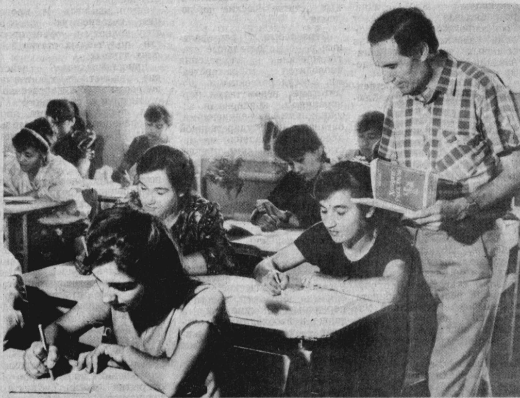
В городе Газалкенте Бостанлыкского района на базе Центра образования молодежи, организованного государством, в этом учебном году открыт колледж. Более 500 выпускников школ района участв в 20 группах, где обучение ведется на 4 языках: узбекском, казахском, таджикском и русском.

Они получают специальности учителей начальных классов, воспитателей дошкольных учреждений, младших медицинских сестер, ревизоров-инвентаризаторов, швей. Лекции по ведущим дисциплинам учащимся колледжа читают опытные наставники. В педагогическом коллективе работают пять преподавателей таджикских высших учебных заведений.