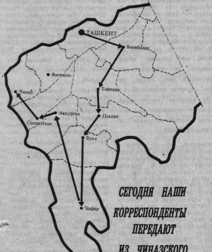
СЕГОДНЯ НАШИ КОРРЕСПОНДЕНТЫ ПЕРЕДАЮТ ИЗ ЧИНАЗСКОГО РАЙОНА

Все это диктует нам необходимость разработки своей программы перехода на национальную валюту. Мы будем работать над этой программой, которая будет корреспондироваться с казахстанской программой. У нас есть желание совместно с Казахстаном разработать такую программу и работать вместе. (Окончание на 2-й стр.)