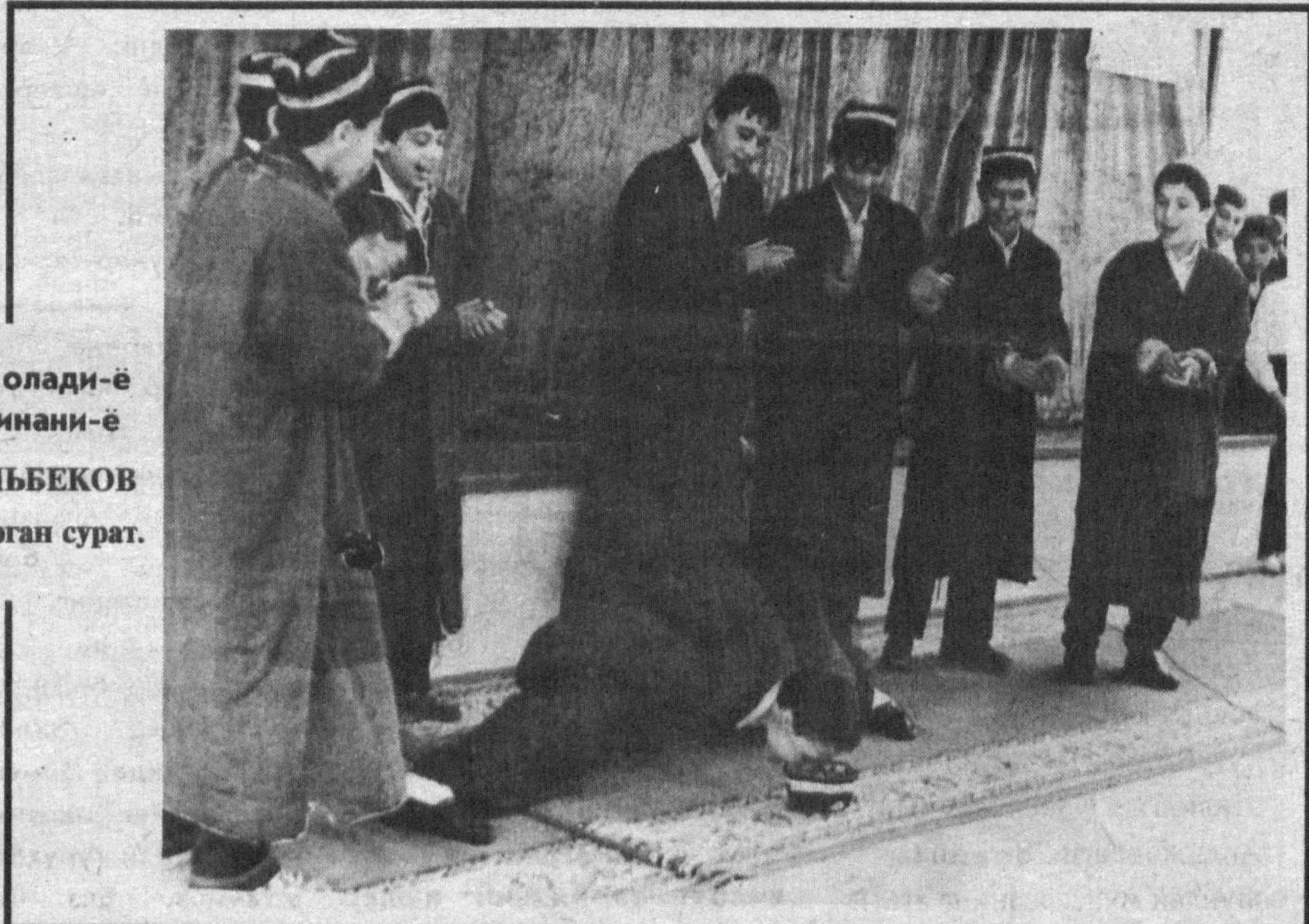
Ким олади-ё шугинани-ё Р. АЛЬБЕКОВ туширган сурат.

Мактабдан ташқари муассасалар бугунги кунда ўқувчиларнинг мактабда олган билимларини мустақамловчи, ҳунар ўргатувчи даргоҳлардан ҳисобланади. Мактабдан ташқари, деб номланишига қарамасдан бу муассасалар илм масканлари билан чамбарчас боғлиқ. Дарсларда ўтилган мавзуларни қўшимча мустақамлаш, меҳнат таълими фани дастурини тўлдириб, болаларга ҳунар ўргатиш бу ижодиёт уйлариининг асосий вазифасидир. Аммо, кейинги йилларда болалар ва ўсмирлар ижодиёт уйлари ҳам барча бошқа соҳалар каби қийинчиликларга учради. Шундай бўлишига қарамай, мактабдан ташқари муассасалар ходимлари бор куч ва билимларини ишга солиб, ижодиёт уйлари, ўқувчилар саройларига болаларни жалб этишга ҳаракат қилишмоқда. Янги тажриба ва дастурларни амалга оширишиб, тўғараклар ишининг қизиқарли бўлишига эришишяпти. Кунни кеча пойтахтдаги Республика Ўқувчилар саройида бўлиб ўтган вилоят ўқувчилар уйлари ходимларининг кенгашида ана шундай янги тажрибалар ва усуллар ҳақида сўз юритилди.