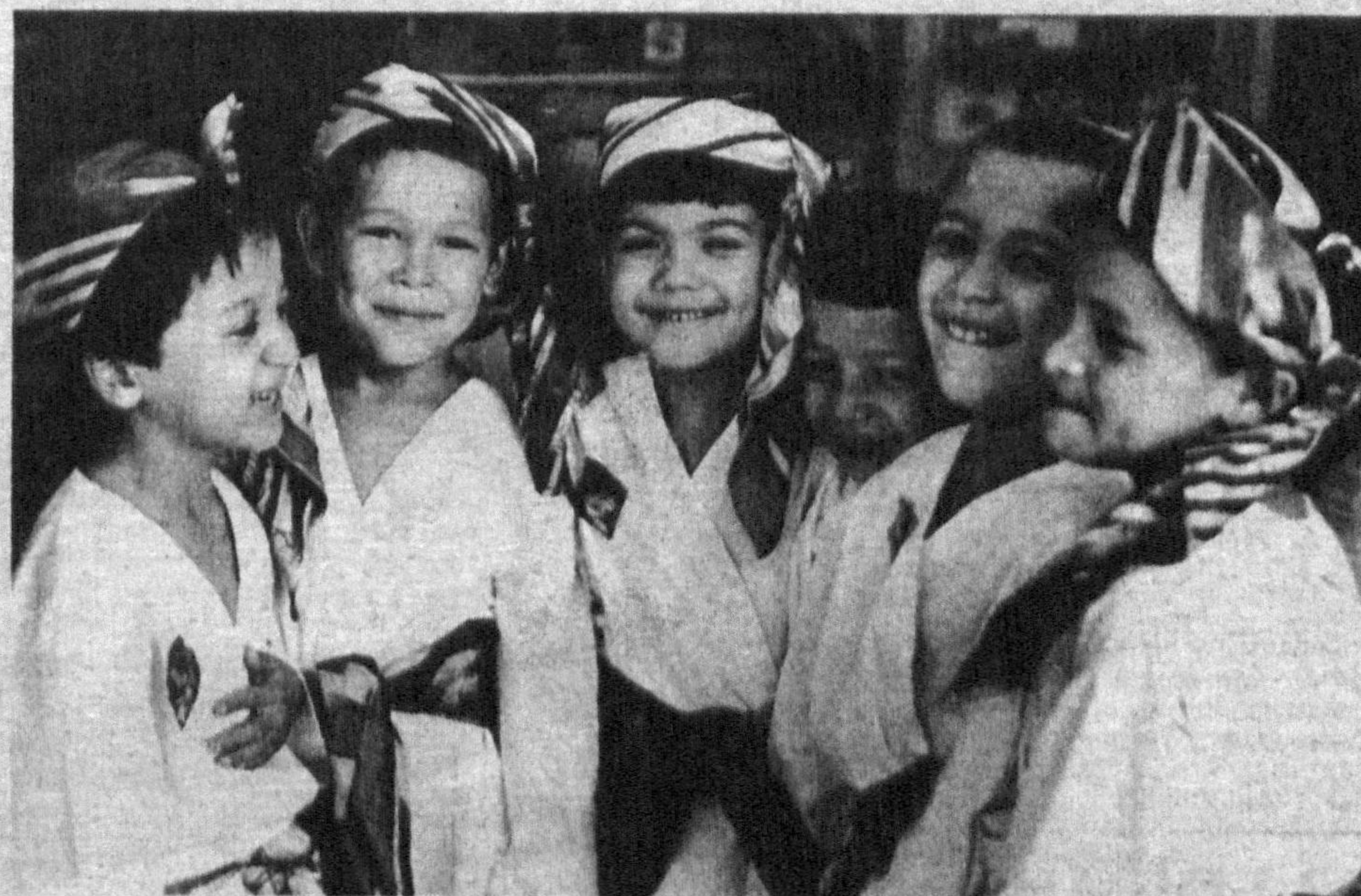
Кулиб туринглар, суратга тушираёпман.

Қадрли болалар! Ҳаётимизда бўлаётган ўзгаришларнинг барчаси яхшилик ва фаровон ҳаёт учун. Шу сабаб ҳам сиз — ўқувчи-ёшлар ушбу қарорда кўрсатилганидек, янги алифбони ўрганишга алоҳида киришасизлар, деб ўйлаймиз.