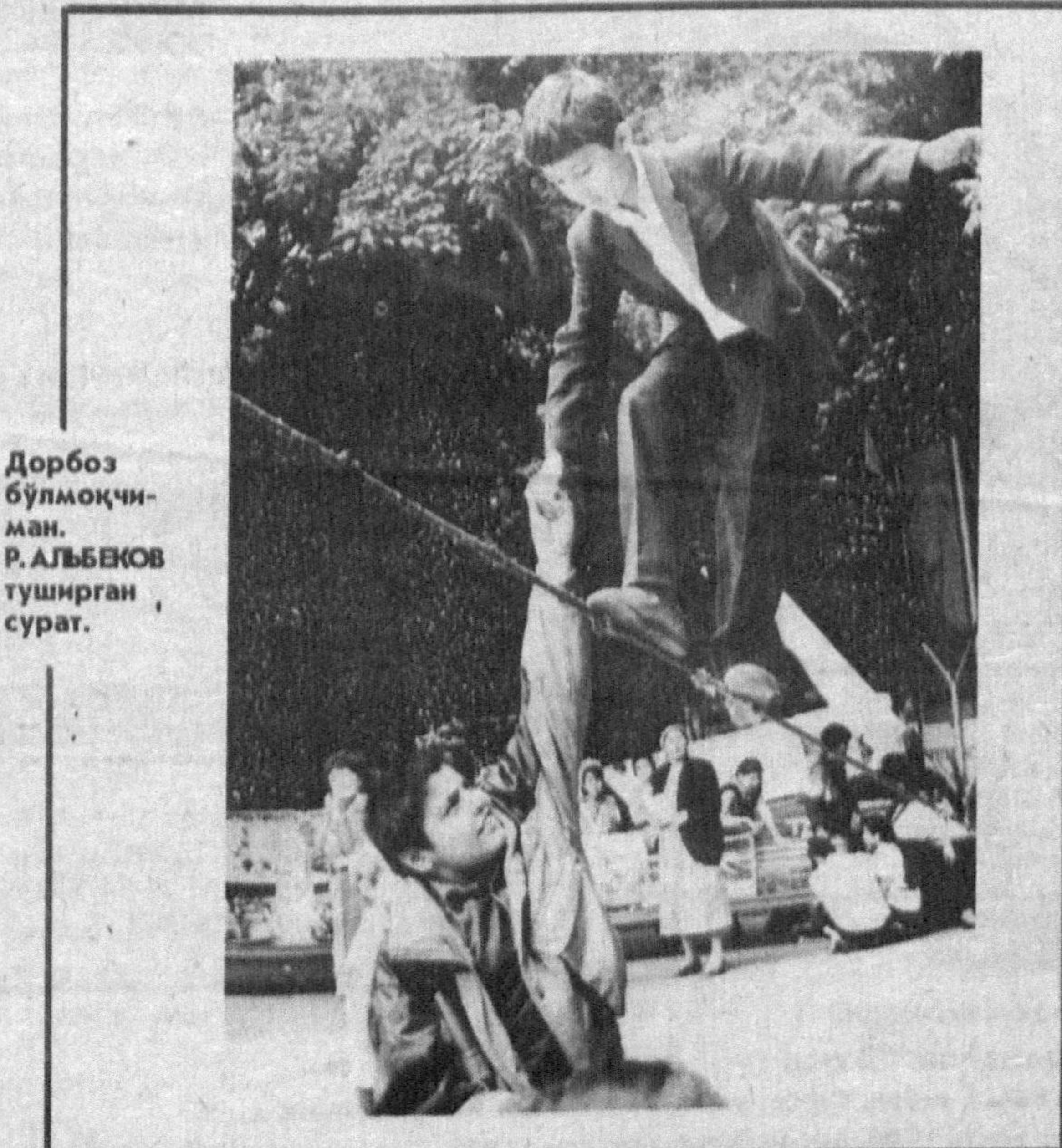
Дорбоз бўлмоқчи-ман.