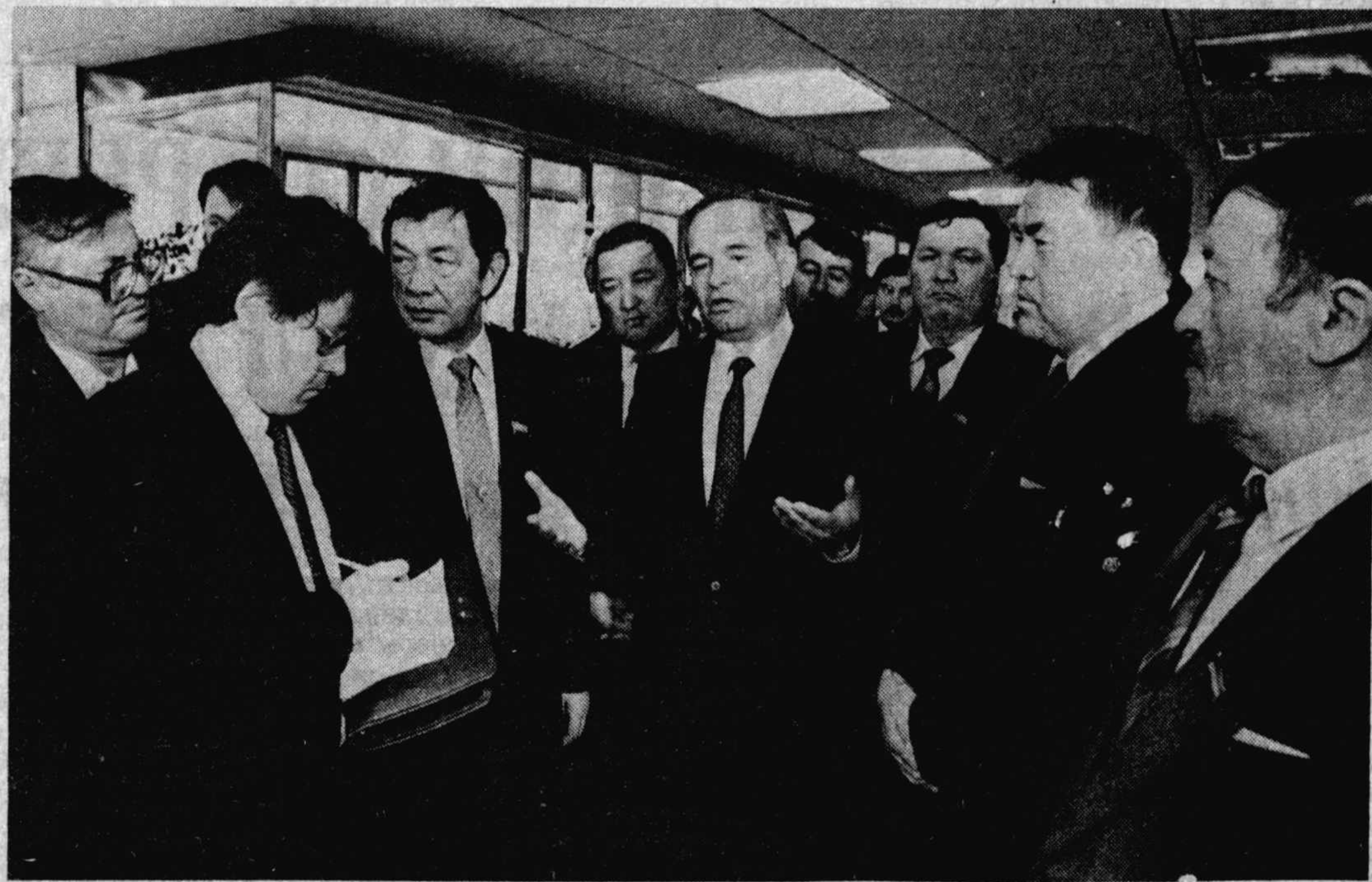
ТАШКЕНТ. Внеочередная четвертая сессия Верховного Совета Узбекской ССР двенадцатого созыва.

Депутаты рассмотрели вопрос о председателе комитета Верховного Совета Узбекской ССР по плановым и бюджетно-финансовым вопросам и по экономической реформе и местному самоуправлению.