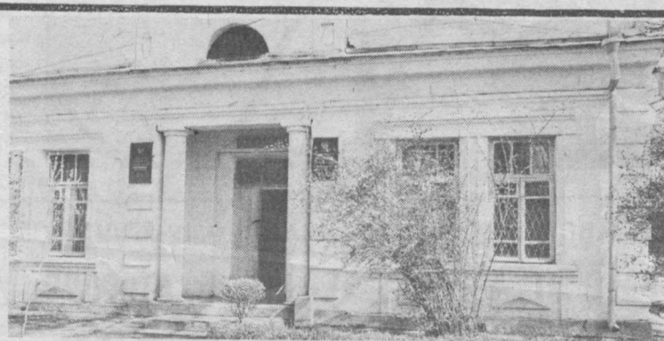
[Окончание. Начало на 1-й стр.]

По всем вопросам участия обращайтесь в организационный комитет фестиваля: Телевизионная компания «Азия-ТВ», 480091, Алма-Ата, Коммунистический проспект, 91. Телефоны: 62-42-72 или 62-41-85; телекс 251232, РТВ СИ; телефакс: 327263 232; 3272 63634. Е. ДОНЕЦ.