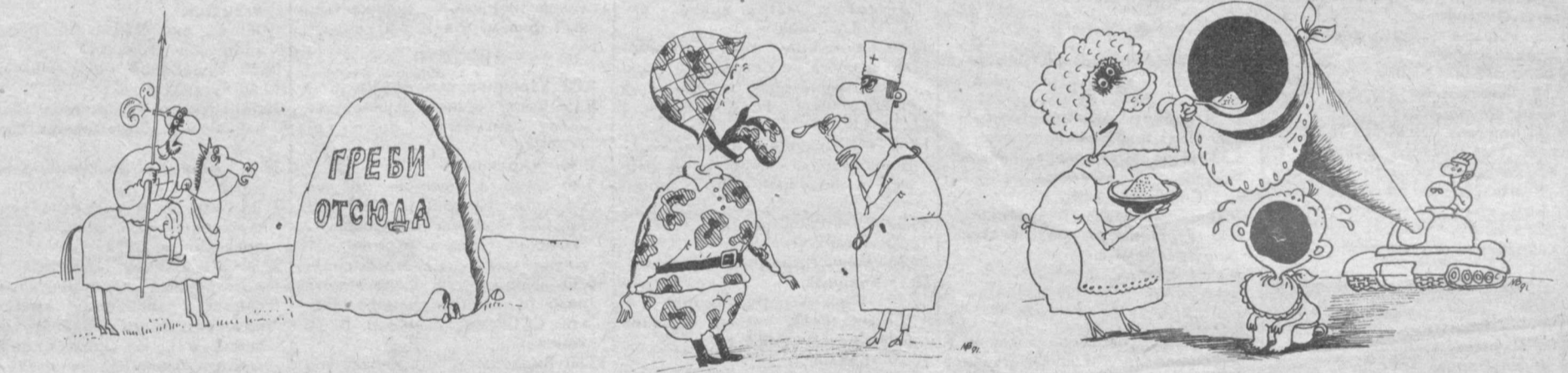
Рис. И. МУРОМЦЕВОЙ.