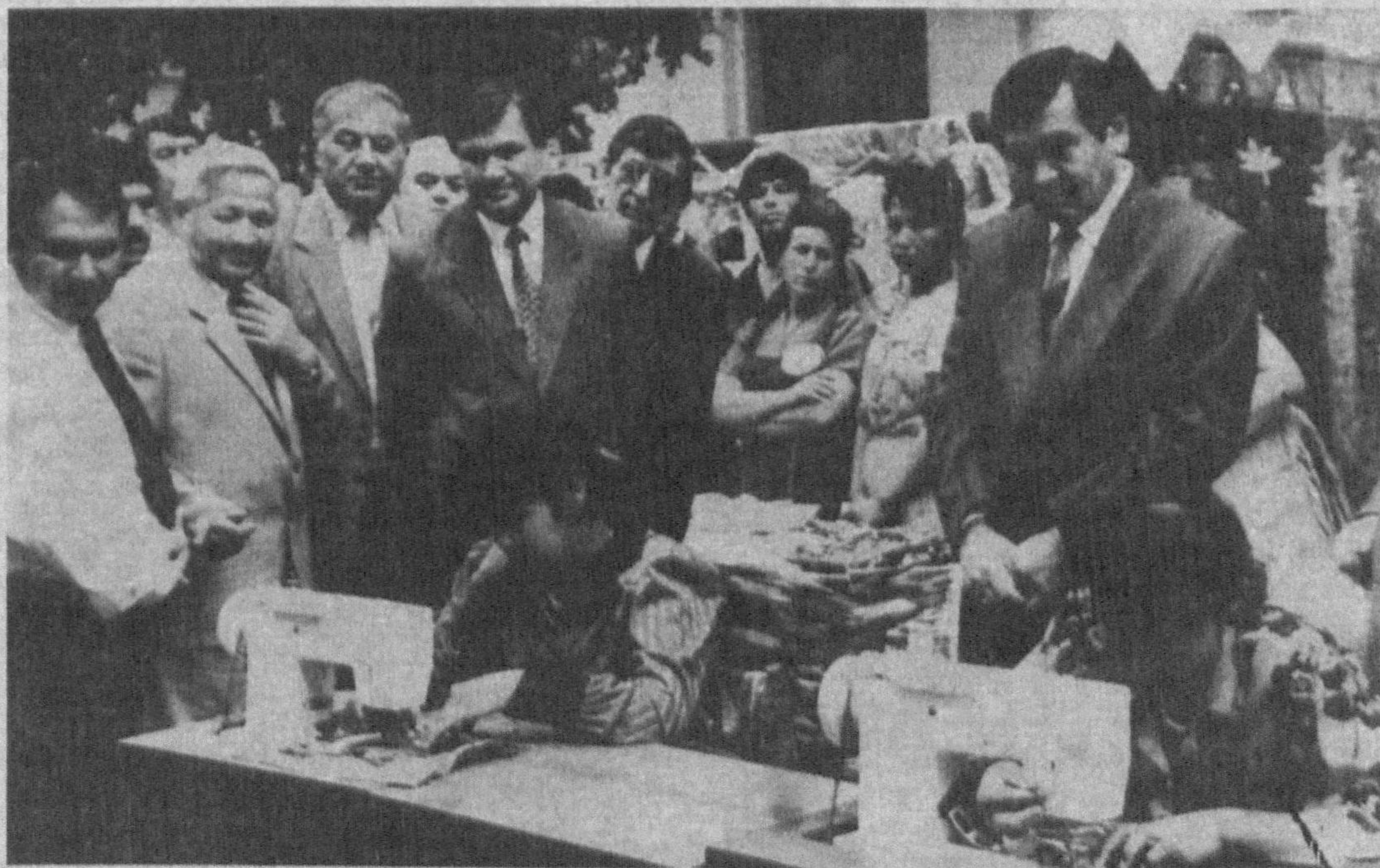
Суратда: Ярмарканинг очилиш пайти.

мон бўлиб, болалар кўлида сайқал топаётган миллий хунармандчилик буюмларини кўздан кечирдилар ва улар билан дилдан суҳбатлашдилар. Бу эса эртанги кун ижодкорларининг илҳомига, интилиш ва изланишларига кўр бўлгани аниқ. Ахир, хунаринг, меҳнатларининг маҳсули кўз-кўзланса, катталар назарига тушиб, ҳалол баҳосини оладиган бозорда ўз қадрини топса — Бахтинг, бахтиёрлигинг тантанаси эмасми? Қолаверса, ярмарка сабаб, турли вилоятлардаги хунарманд тенгдошларинг билан танишиб олганинг ҳам катта қувонч-ку!