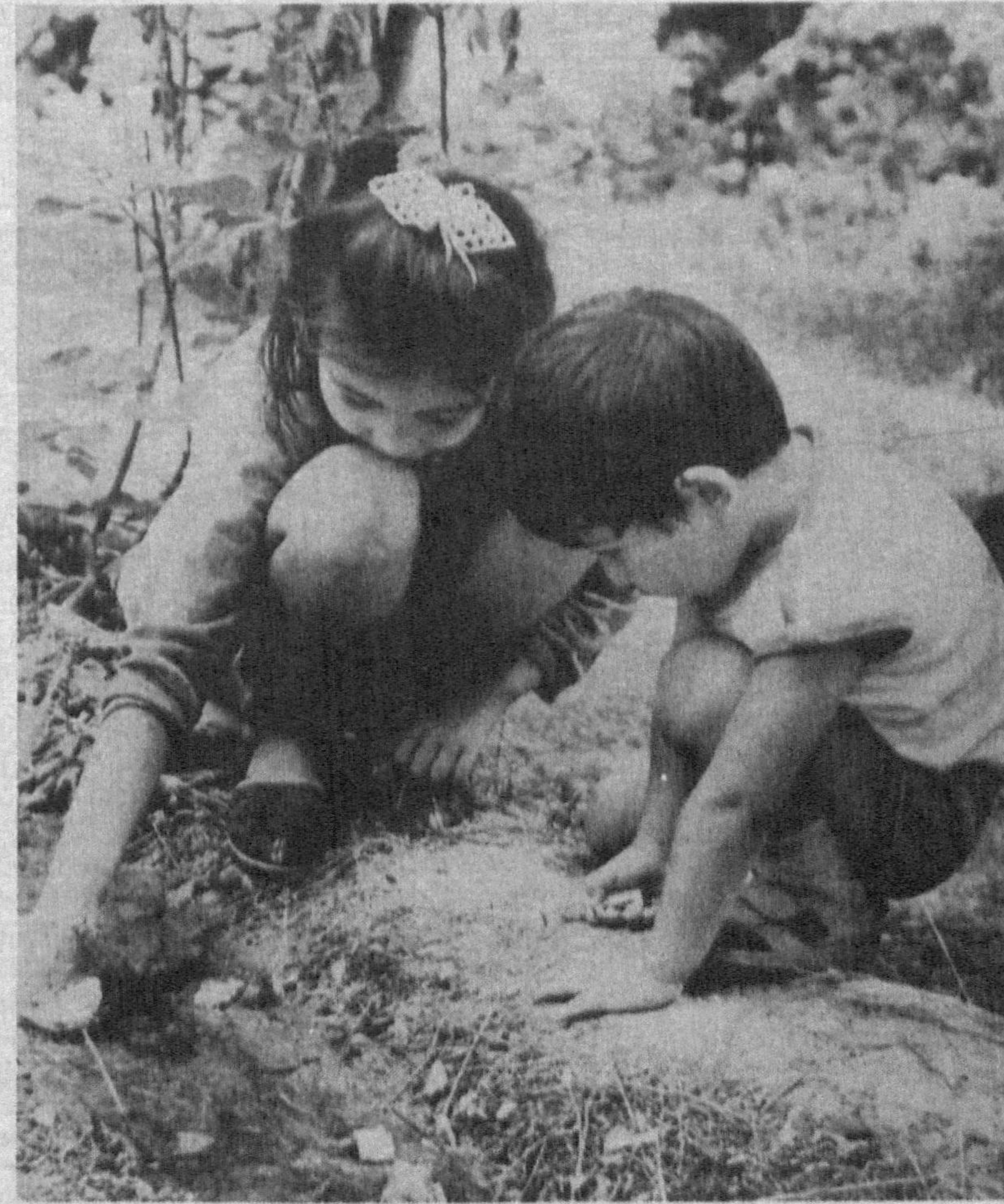
Топгин-чи: Кетар, кетар, изи йўқ, Таянмоққа тизи йўқ. Топдим. Бу — ...

Беғубор, беғубор боласан, Ун олти ёшда ҳам бола, шўҳ Тушунгил қалбимнинг ноласин, Тушунгил, не учун кўнглим чўғ. Не учун юзларим лоладай, Қаршингда бахтиёр куламан Тушунгил, тушунгил, болакай, Йўқса шу кулганча сўламан! Ун олти қаршилар мени ҳам, Ахир биз ўсдик-ку, бирга тенг. Дилгинам ёнар, лол тилгинам Сенинг-чи юрагинг бунча кенг? Кўнгироқ қиламан уйингга, Сен-чи тўп тепасан қайдадир! Берилиб кетасан ўйинга, Менга-чи на у, на бу татир! Қаршингга чиқаман, қаршимда Ёясан қандайдир расмлар. Ё шахмат сурасан, ёки сан Бошлайсан қандайдир баҳслар... Беғубор, беғубор боласан, Ун олти ёшда ҳам бола, шўҳ. Тушунгил қалбимнинг ноласин, Тушунгил, тушунгил, йўқса... йўқ!