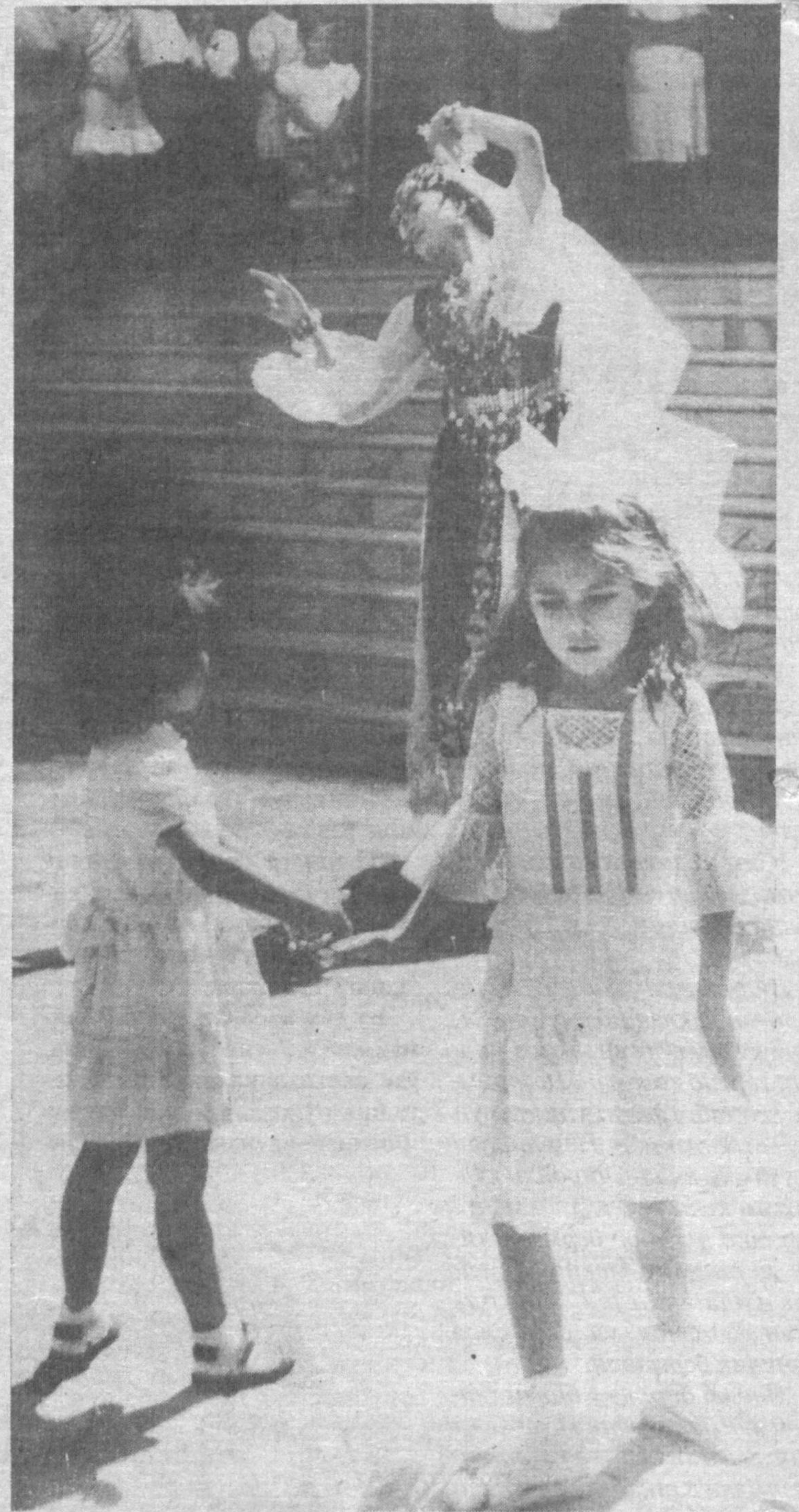
Юр, рақсга тушамиз.