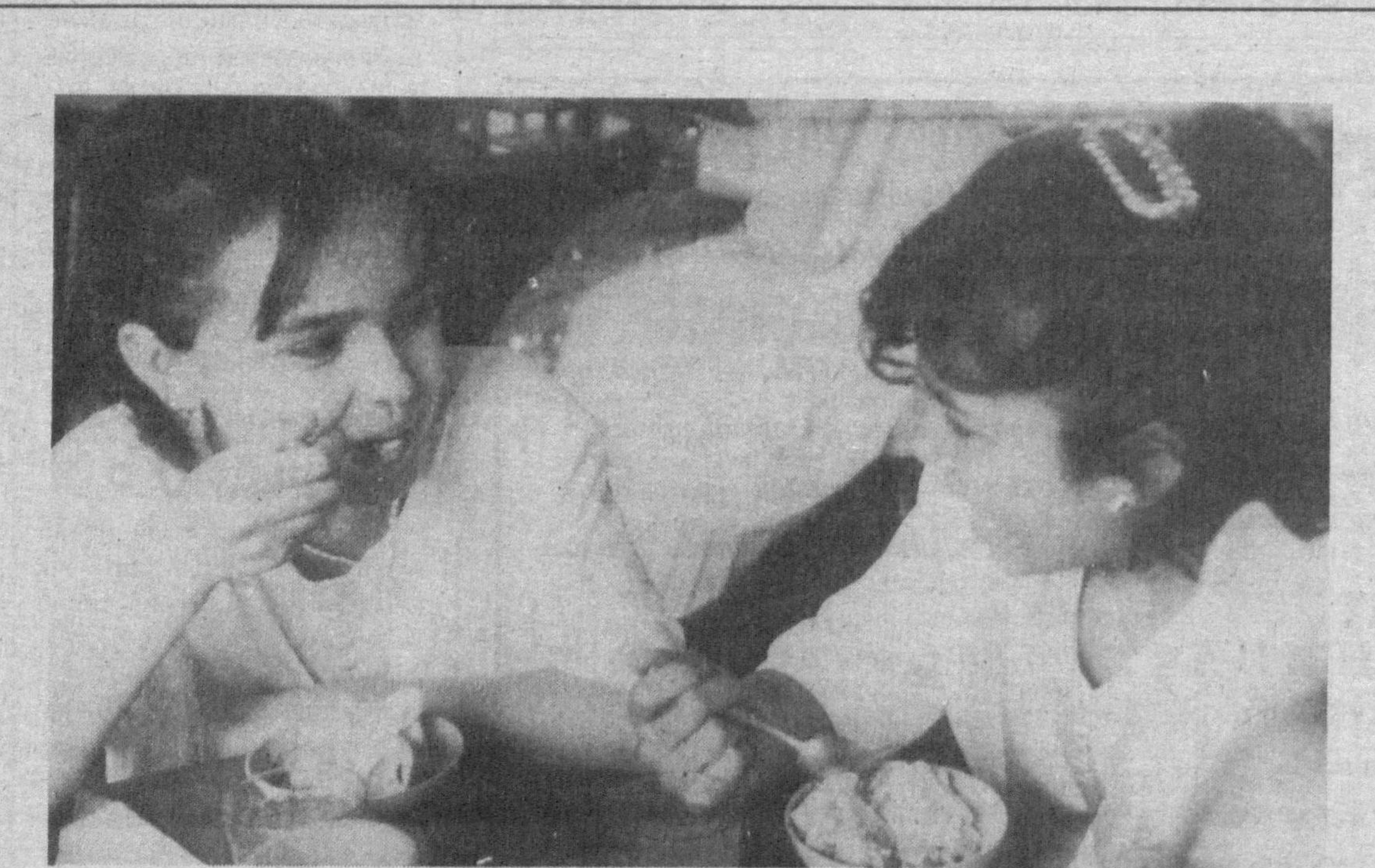
Опа-сингил Озода ва Зиёдахонларнинг нияти: «Музқаймоққа тўйсин болалар, музқаймоқдай бўлсин бу ҳаёт...»