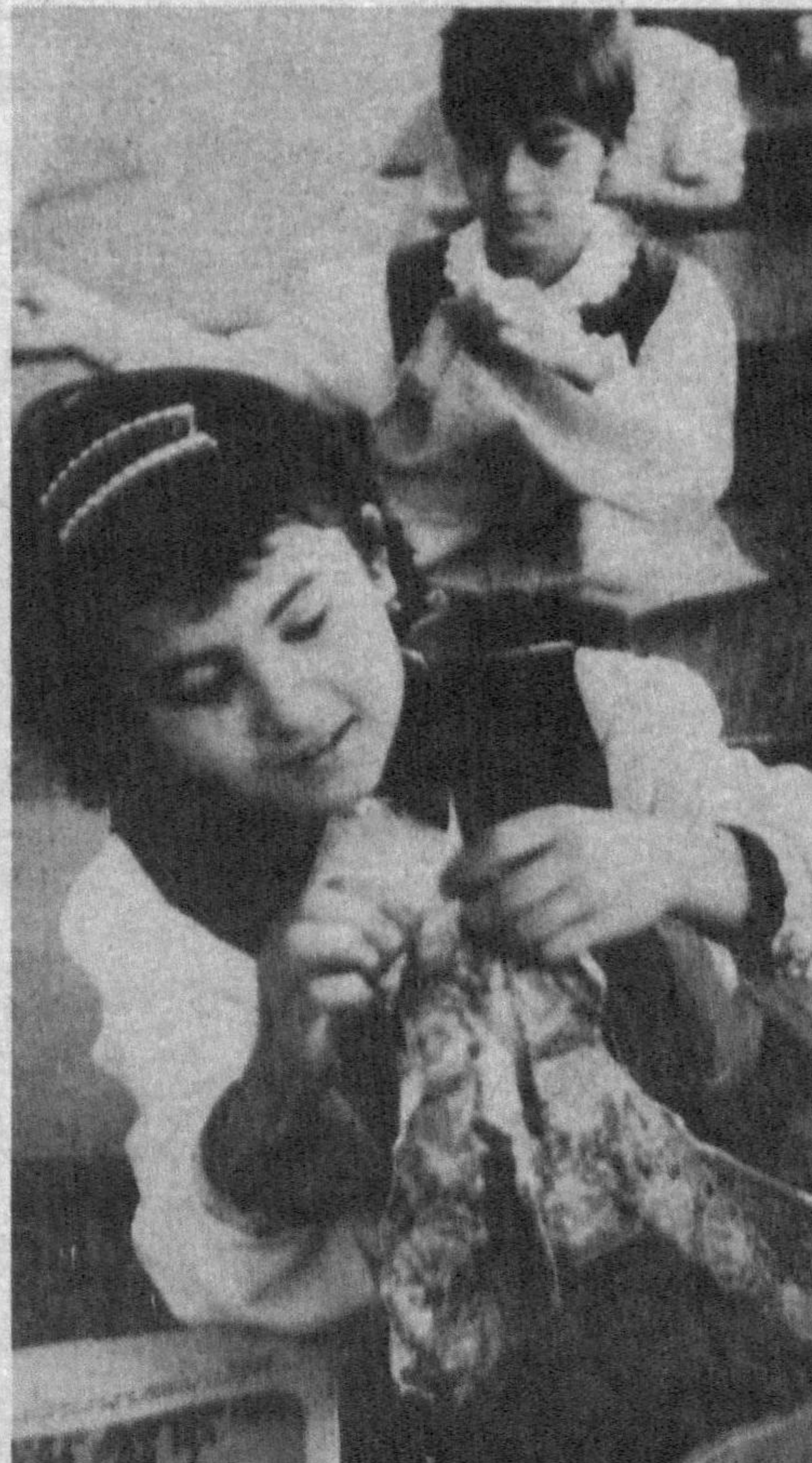
СУРАТЛАРДА: 299-мактабнинг қуни узайтирилган гуруҳларида машғулот пайти; 4-синфда меҳнат дарси.

Ҳақиқатан ҳам, Тошкентдаги 299-мактабда барча фанлар аъло даражада олиб борилиши билан биргалиқда қуни узайтирилган гуруҳларнинг иши ҳам яхши йулга қуйилган. Бу ерда айниқса, қуни синф ўқувчиларининг дарслардан сунги вақтлари бекор утмаслиги учун барча имкониятлардан фойдаланилади. Болалар бу соатларда утилганларни такрорлаш билан бирга расм чизишди, бадий китоблар ўқишди, дам олтиш соатлари утказишди. Бу эса уларнинг буш вақтларини мазмунли утишга ҳам кумак булмоқда.