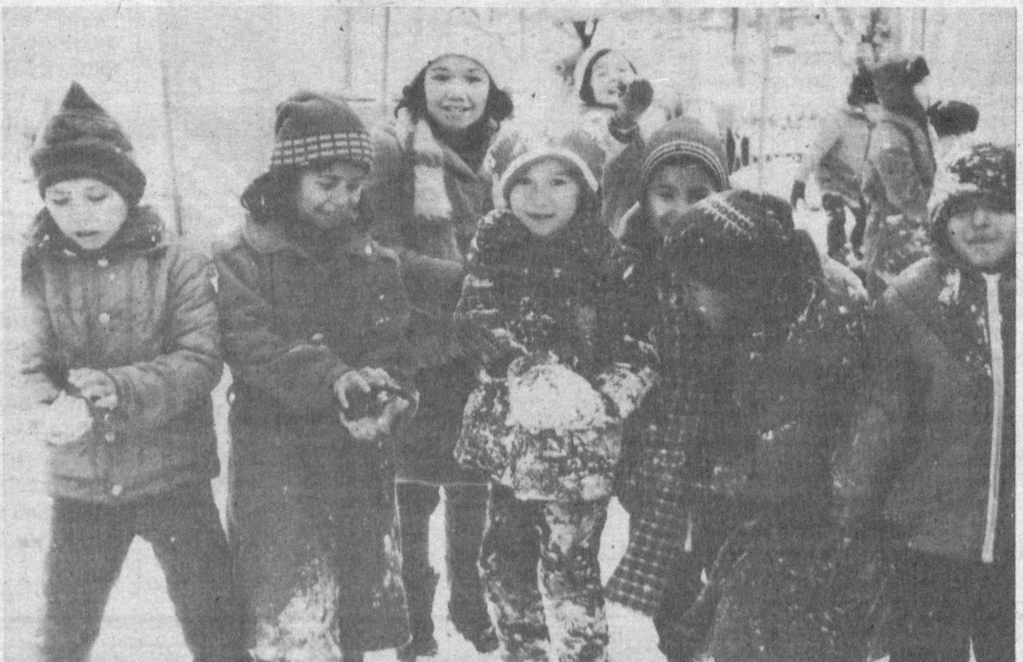
Қор ёғади, қорки бегўбор, Гуё тўзғир зарли толалар.