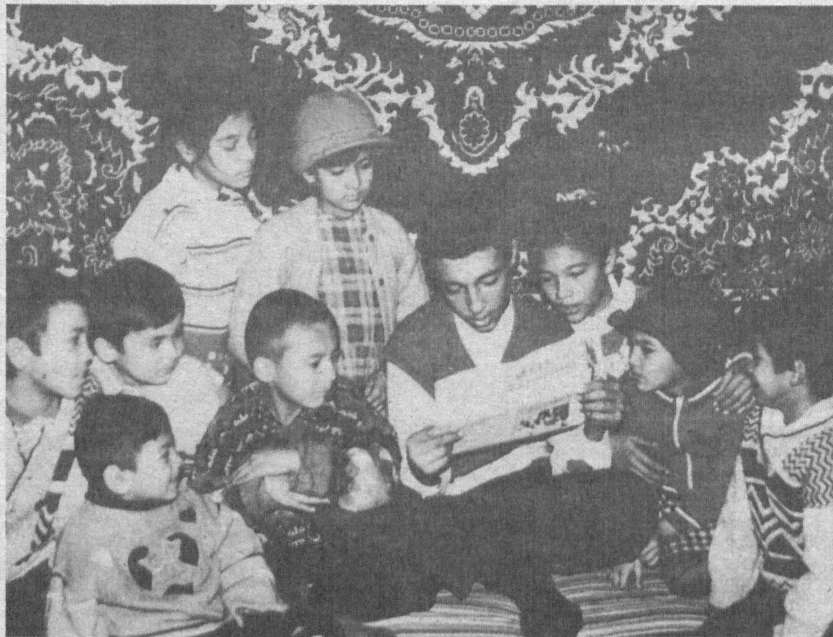
Ўқиб, ўрганиш лаҳзалар

Тахририятдан: Тенгдошингиз Салима ҳикоя қилган болалар халқимизнинг қадимий ва анъанавий қўшиқларидан Рамазонни айтиб қишлоқдошларини хушнуд этса, иккинчидан, ёлғиз яшайдиган қариялар кунглини кутаришдек савобли ишларни бажаришга ётган экан. Тугри, онахонлар болалар жамгарган ноз-неъматлари уч-тўрт сум пулга муҳтож эмаслар. Лекин халқимиз орасидаги меҳр-оқибат, сахийлик, ҳамдардлик хислатлари болалар сабаб бувижонларимиз кунгли тоғдек кутарилса ажаб эмас. Сизлар ҳам шунақа болаларни учратганмисиз?