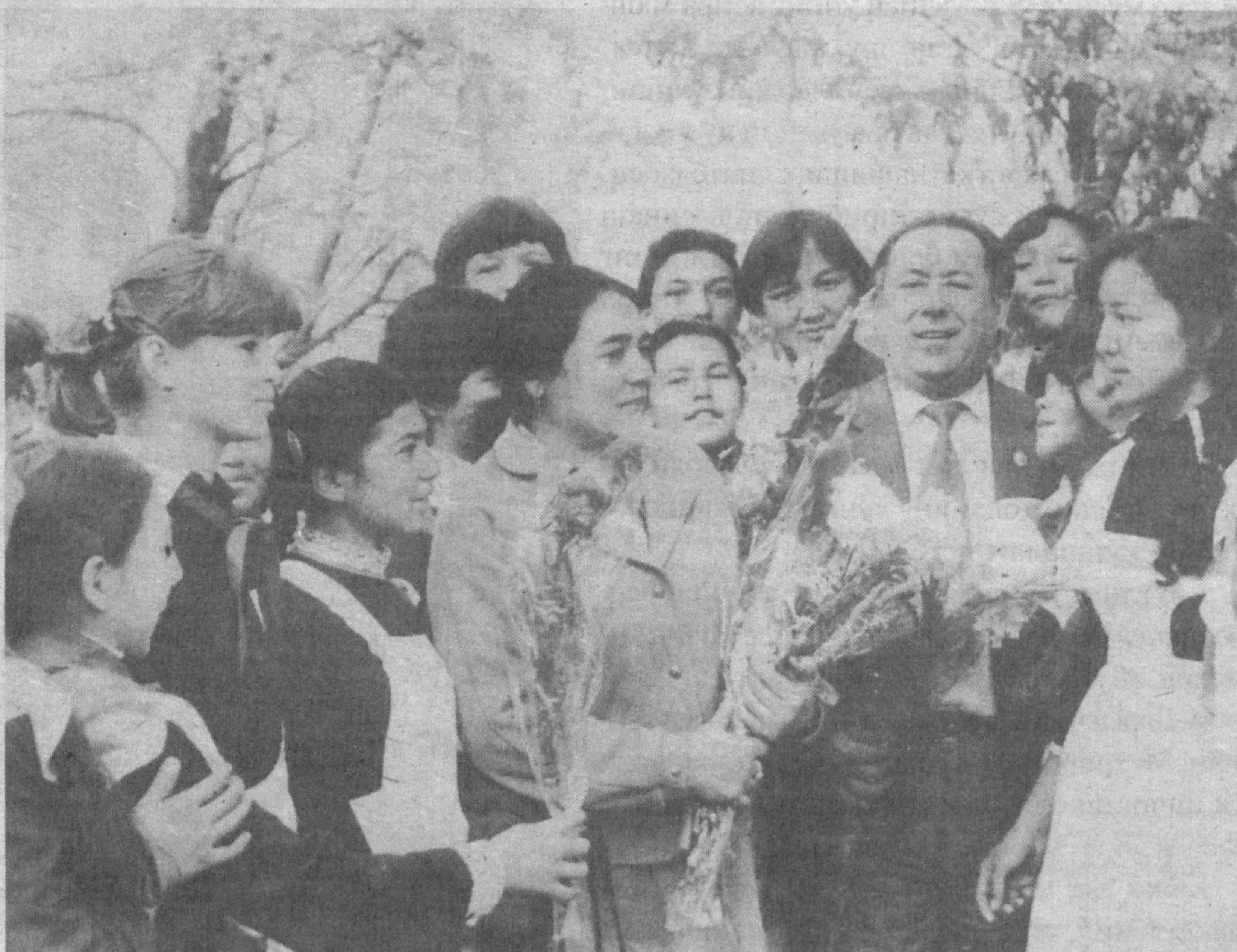
«Олам бахти сиз билан,»-деб болажонлар учун куйинган Гулчехра она!

Сен бўлганда бир кун она, Дерман яна: кел, болажоним, Тасаддуқ жоним!