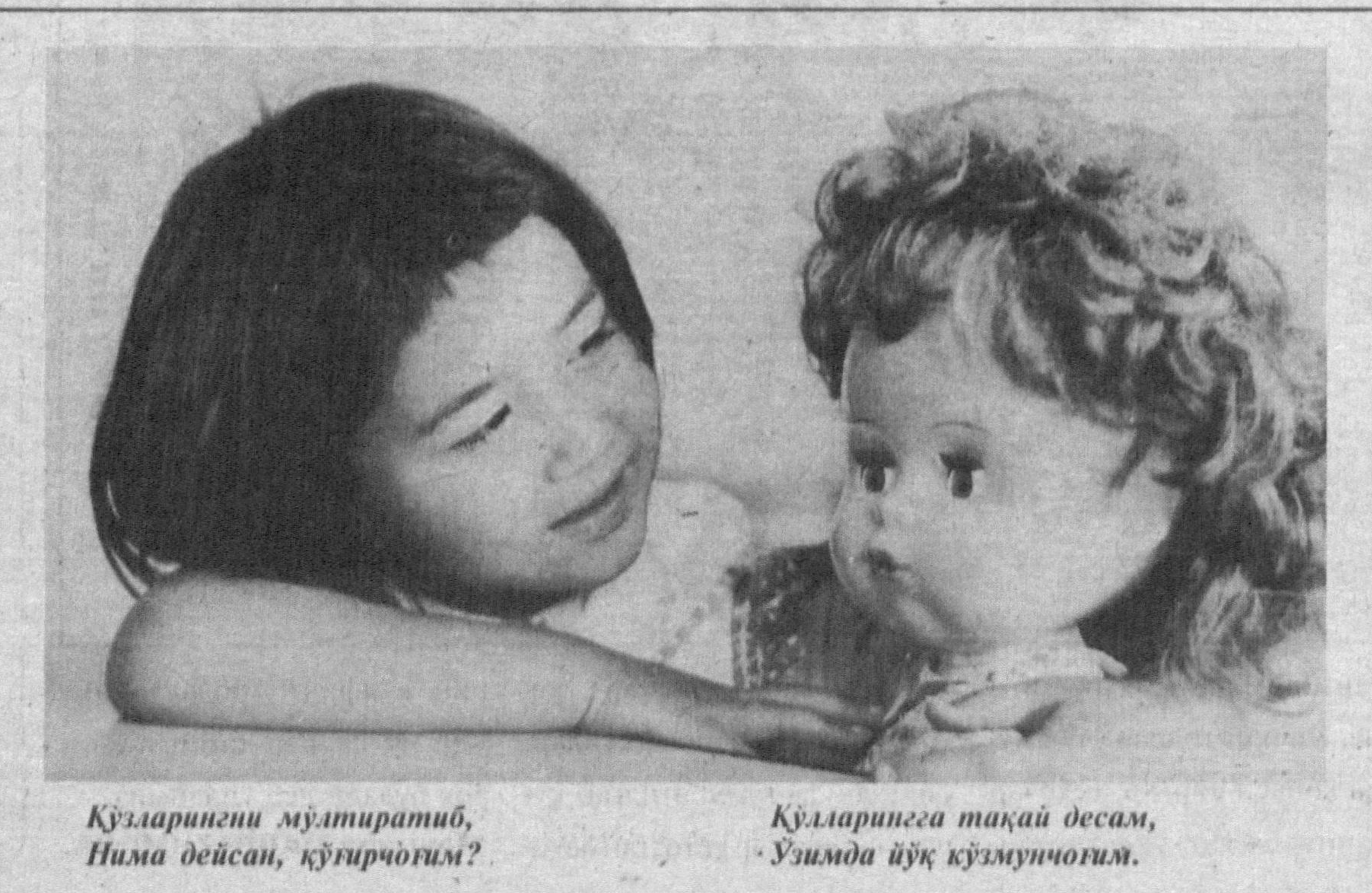
Қузларининг мўлтиратиб, Нима дейсан, қўғирчўғим?

Навруз кунига онажоним-га атаб ажойиб совға тайёрла-моқчиман. Қанақа совға деяп-сизми? Уларга уз қулим би-