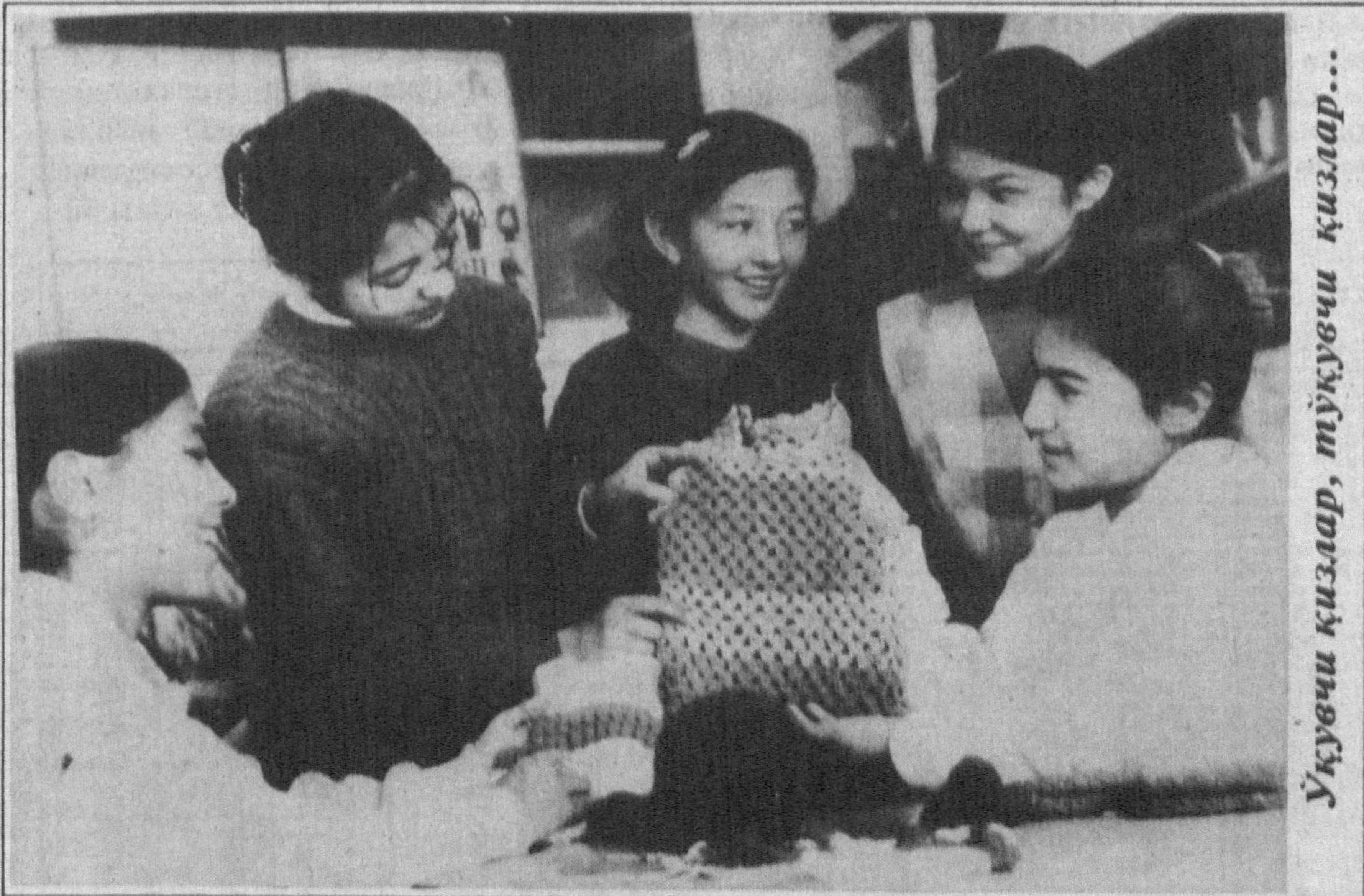
Уқувчи қизлар, тўқувчи қизлар...

Пойтахтимизнинг Мирзо Улугбек туманидаги 504-болалар боғчасида ҳамиша баҳор! Хоналар наинки гуллар, гуллоладек гуркираб усаётган болалар билан файзли. Угил болалар ва қизлар алоҳида гуруҳларга ажратилган. «Нодирабегим» гуруҳида катта ёшдаги қизчалар тарбияландилар. Улар бир-бирларини ҳурмат қилиш, уй ишларида ота-оналарига ердам бериш, бичиш-тикиш, туқиш сирларини урганадилар. «Паҳлавон» гуруҳида угил болалар эса жисмоний жиҳатдан бақувват, мард ва ватанпарвар бўлиб