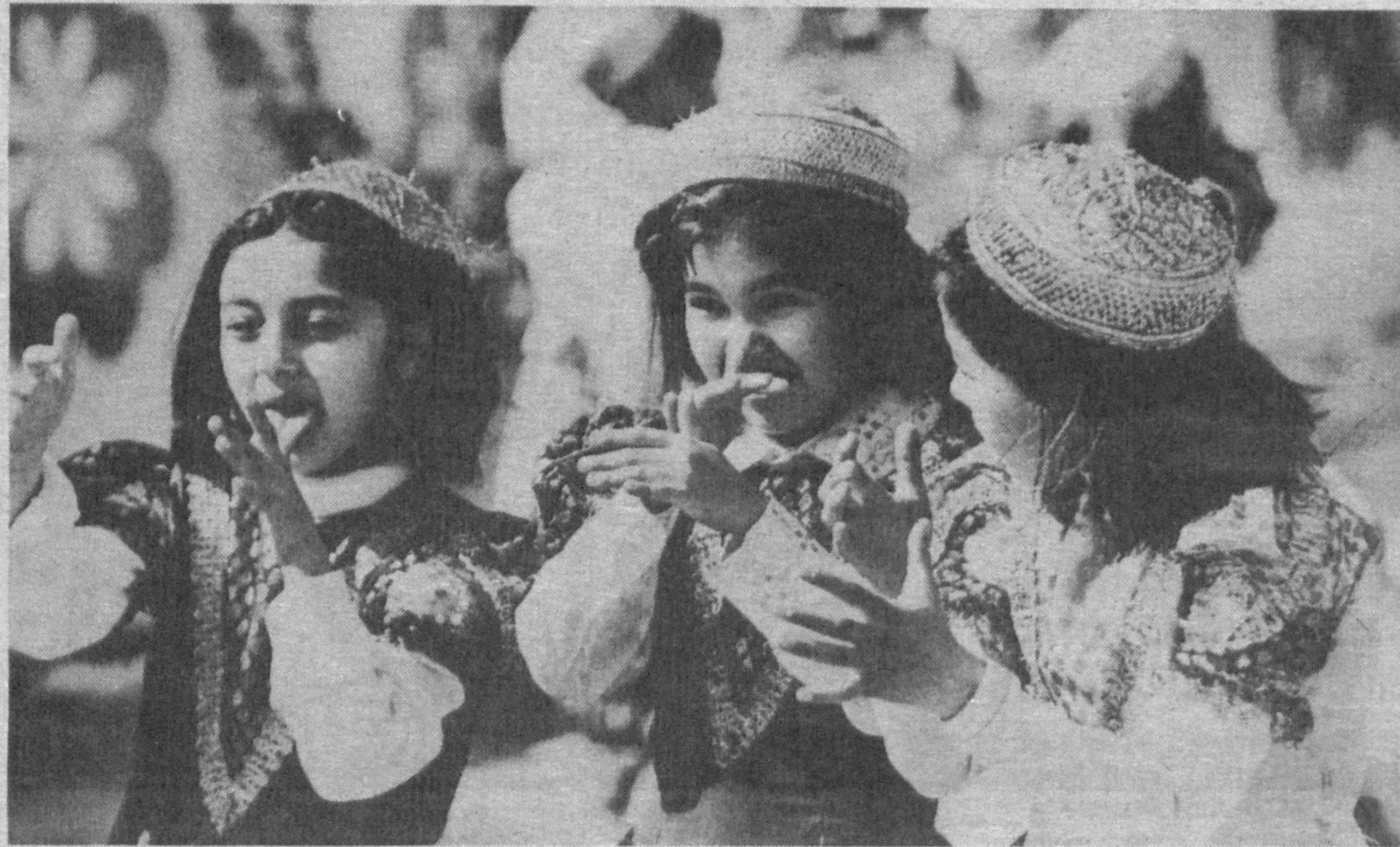
Эркалайди бизларни мактаб, Санъатсевар қизларни мактаб...