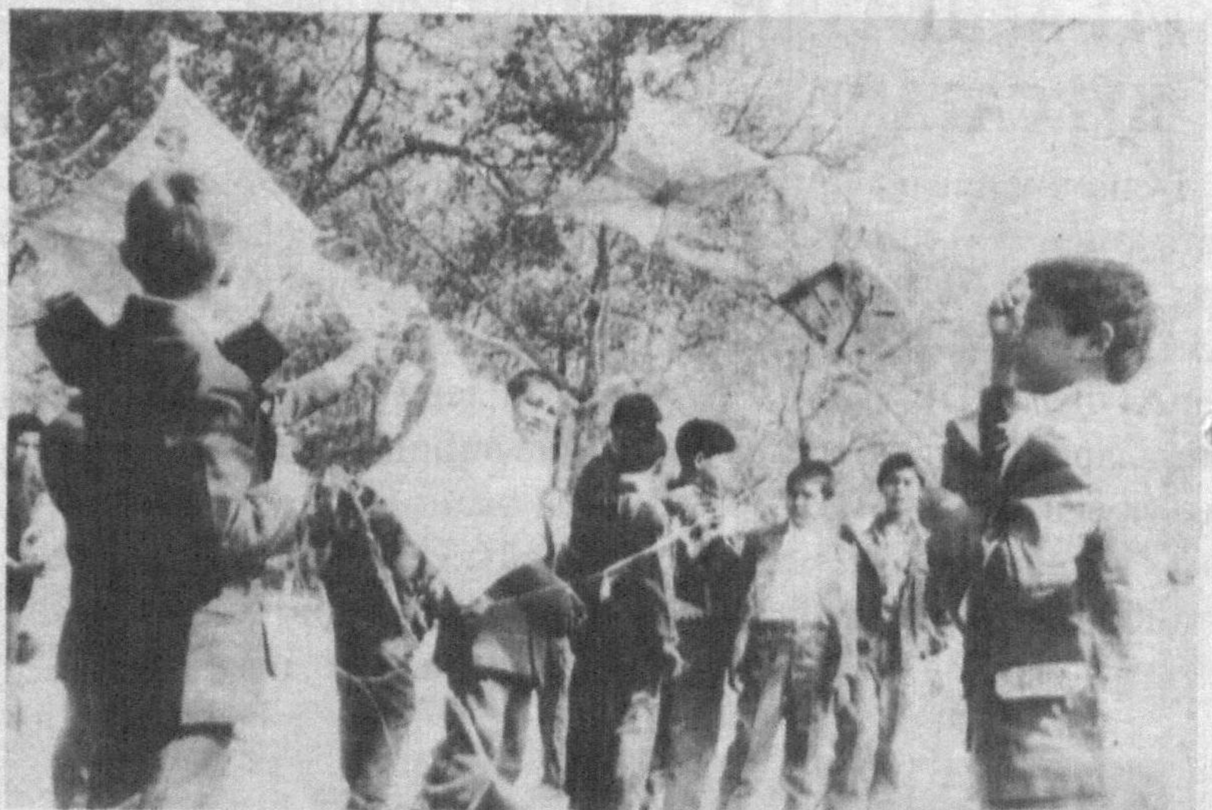
Баланд учган варрақлар, Гул баҳорни дарақлар

Мактабдан қайтар эканмиз, мактаб гирдини қуршаган дарахтлардан бир туп қушлар «дув» этиб учишди-да, олис-олисларга парвоз қилишди. Биз биламиз ва ишонамизки, ҳадемай хорижий