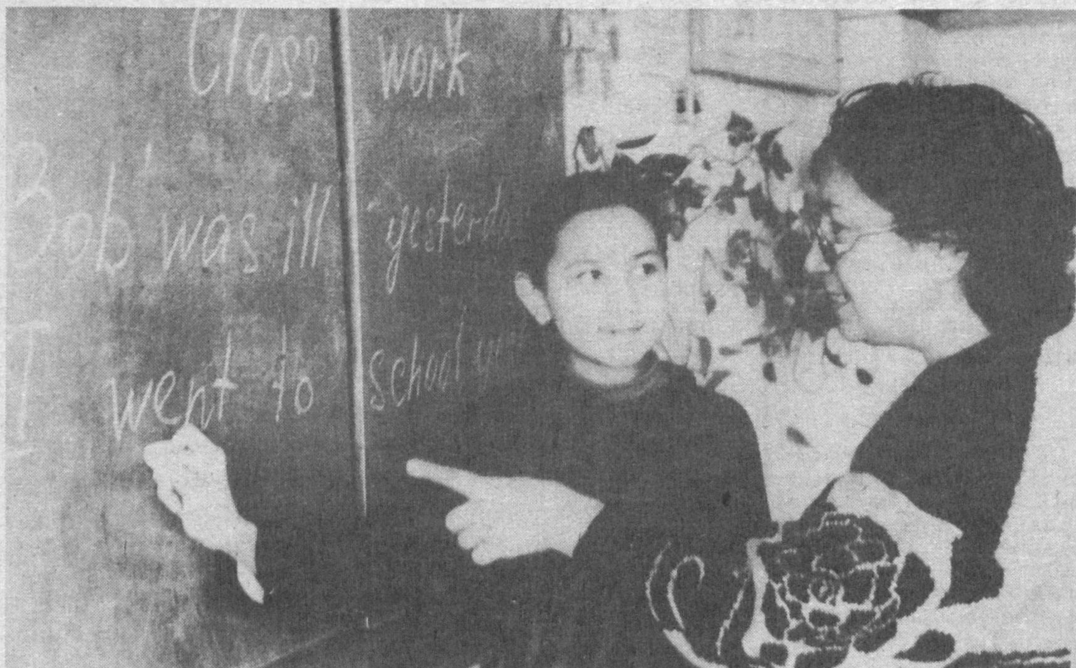
Чет тилини ўрганиш учун тинимсиз машқ қилиш керак...

9 апрель—Соҳибқирон бобомиз таваллуд топган кун