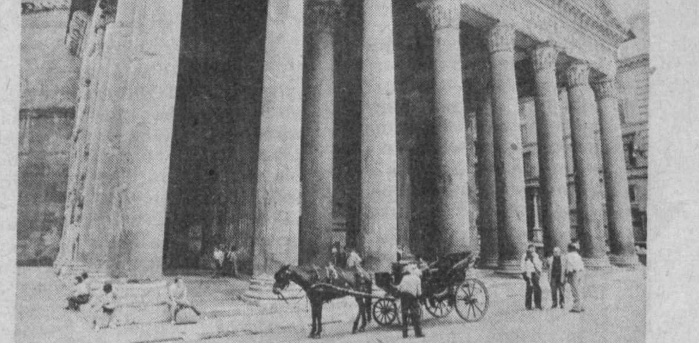
Италия. Скоро на Апеннинском хребте потянутся потоки туристов из всех стран мира. Гиды возле Пантеона в Риме — в ожидании клиентов.

На снимке: Л. С. Куличенкова [слева] и П. П. Силин с учениками школы № 48 на городище Кугантепа.