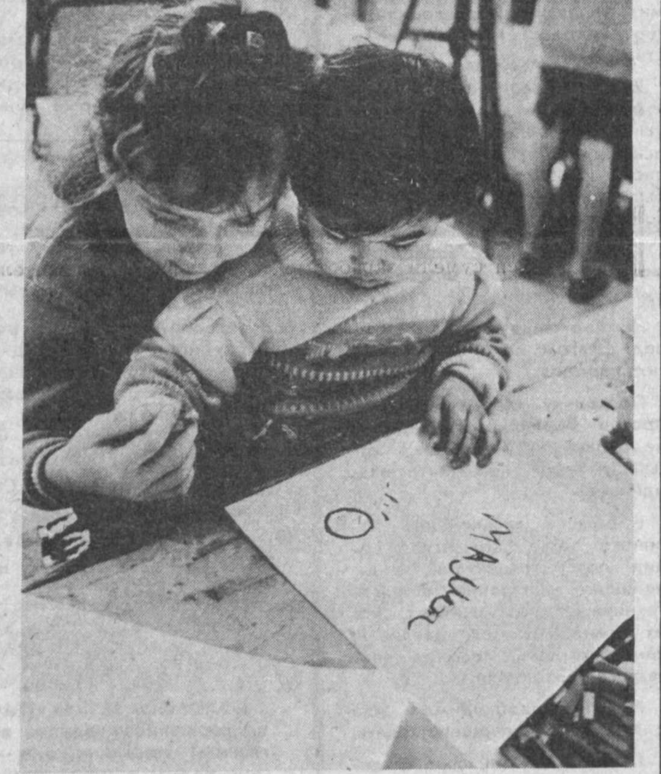
ПЕРВЫЙ РИСУНОК — ДЛЯ МАМЫ