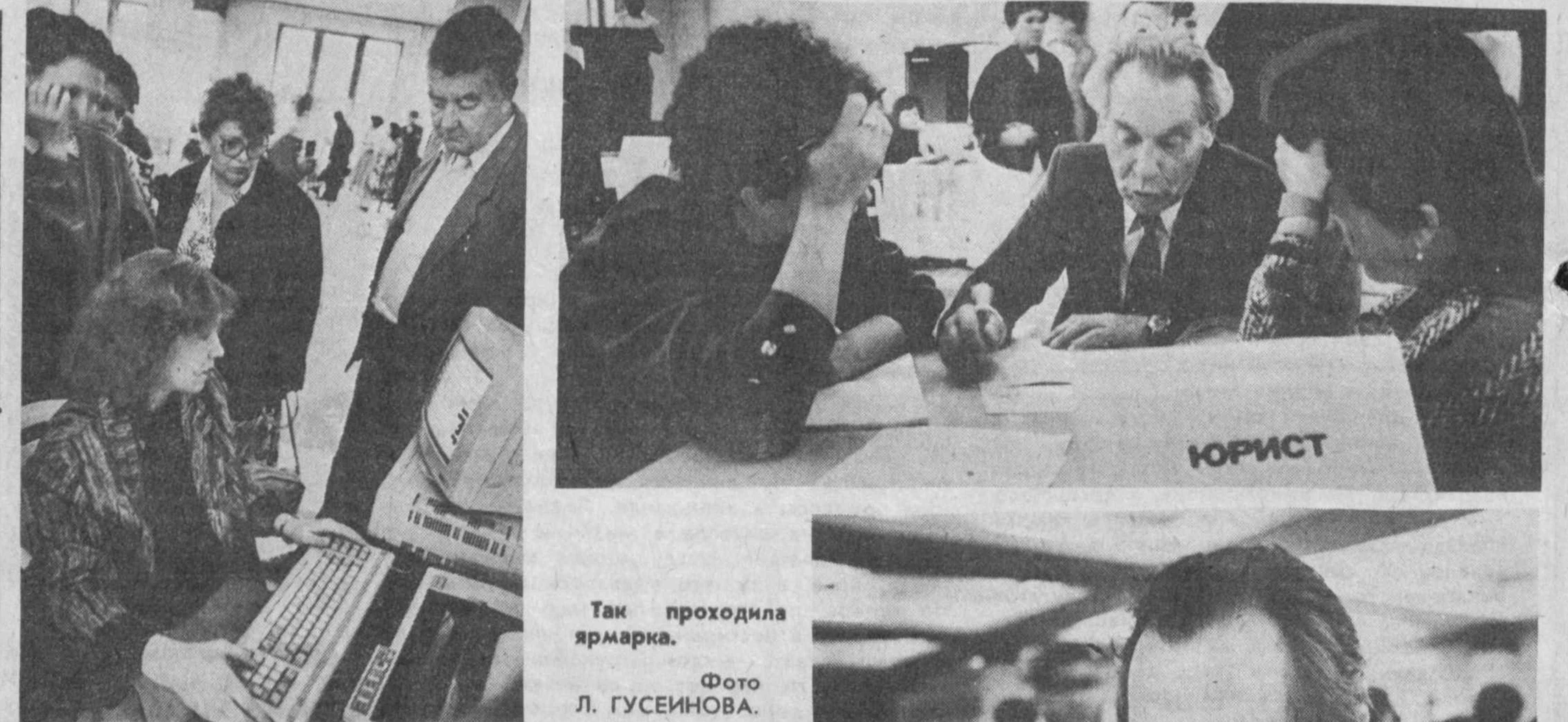
Так проходила ярмарка.

Указ Президента Узбекской ССР публикуется на 1-й стр.