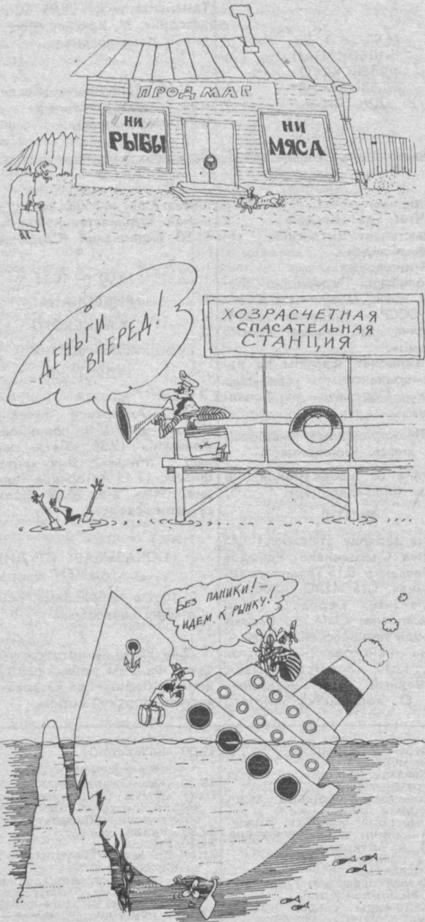
Рис. В. МУРОМЦЕВА.