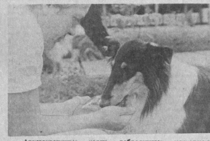
Аристократичные куклы, добродушные овчарки... Многообразие пород, окрасов, характеров

В экспозиции Государственного музея искусства Узбекской ССР есть портреты двух генералов русской армии — И. Ф. Удому и П. Л. Давыдова, написанные известным английским мастером Джорджем Доу (1781 — 1829).