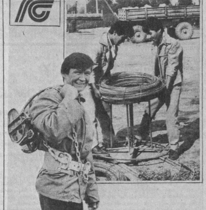
Областное управление Госстраха Ташкентской области. Экспериментальное рекламное агентство «Эра».

Подробнее познакомиться с условиями договора и заключить его вы можете в инспекции Госстраха или у страхового агента.