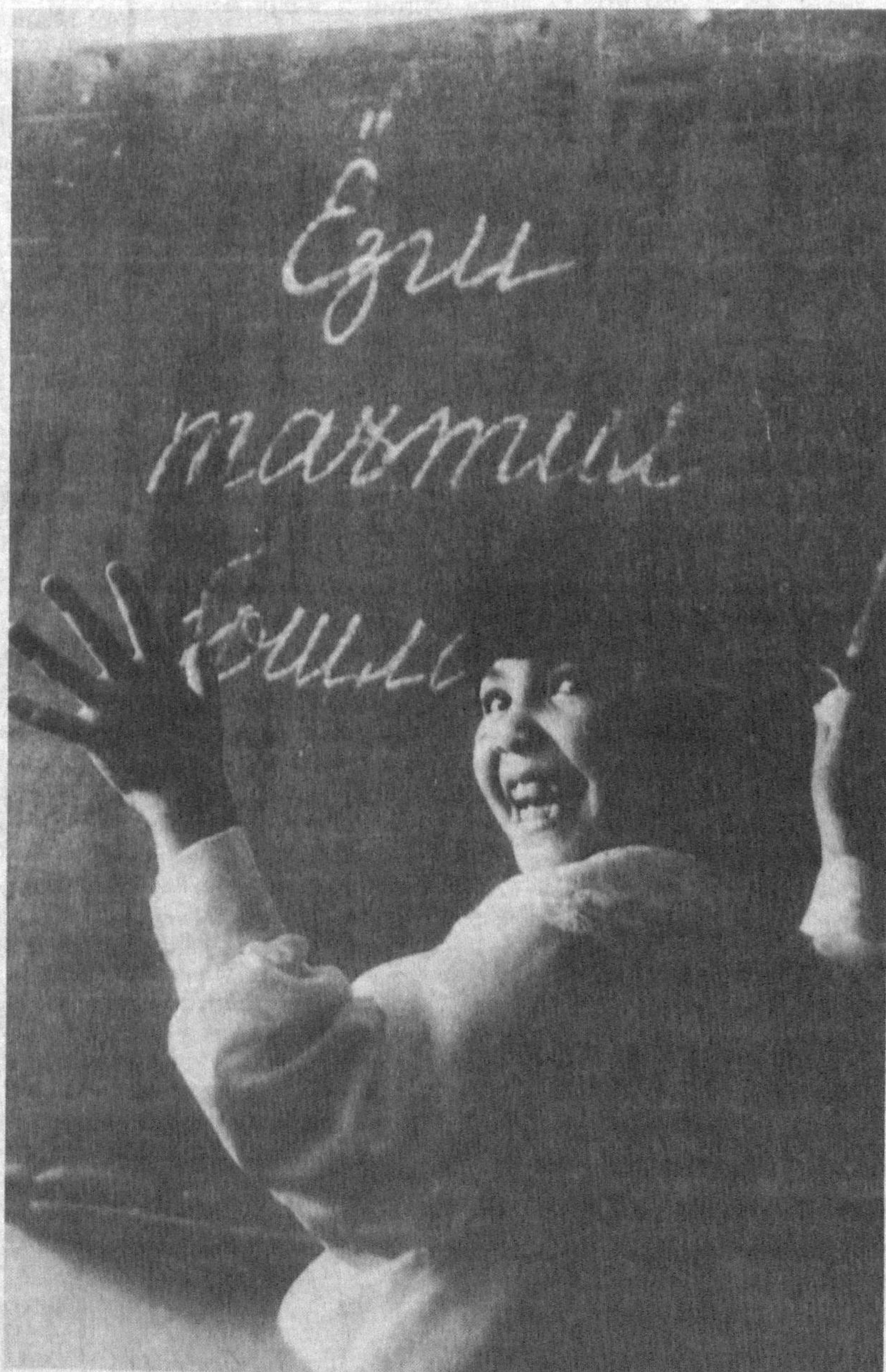
Сураткаш: Р. АЛЪБЕКОВ.

Кул қизалоқ, яйра қизалоқ, Истиқлол, истиқбол сеники. Орзуингдек йулинг ҳам порлоқ, Хур Ватану иқбол сеники.