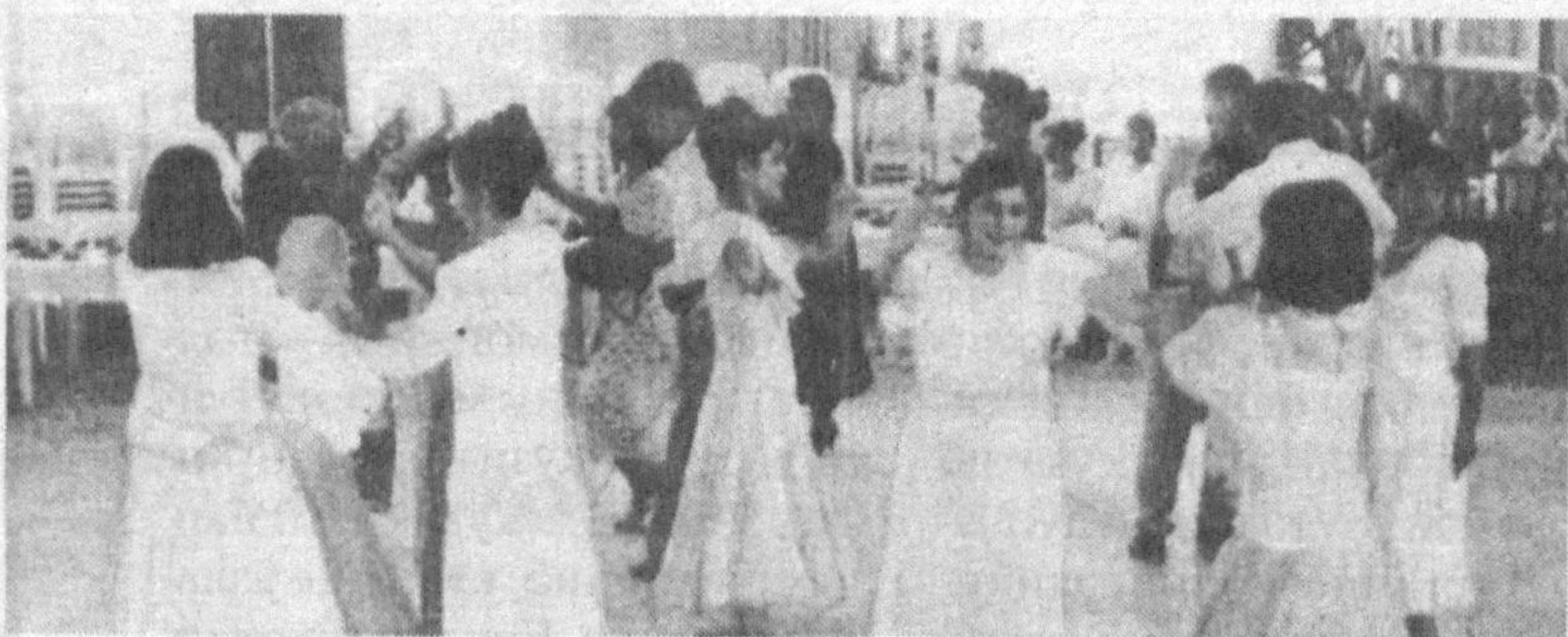
Тошкентдаги 34-мактаб битирувчиларининг хайрлашув ҳаяжонлари.

— Даврнинг учкур қанотида учаётган шитоб уларнинг тарбиясига таъсир қилиши табиий. Улардаги қатъият, мустақиллик, чидам каби хислатлар эса ҳозирги вақтнинг, жамиятнинг талабидир.