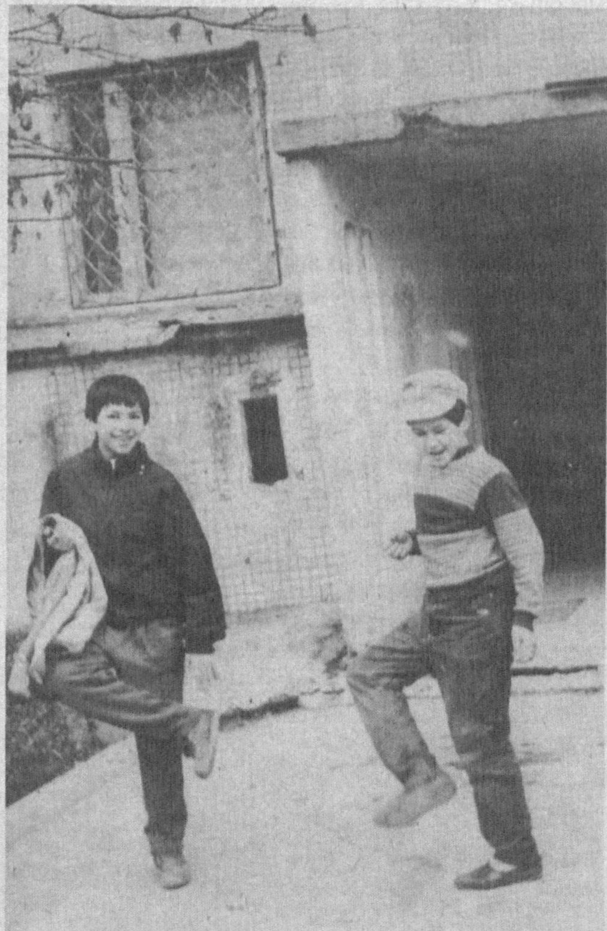
Унда учта кепка бор, менда эса...