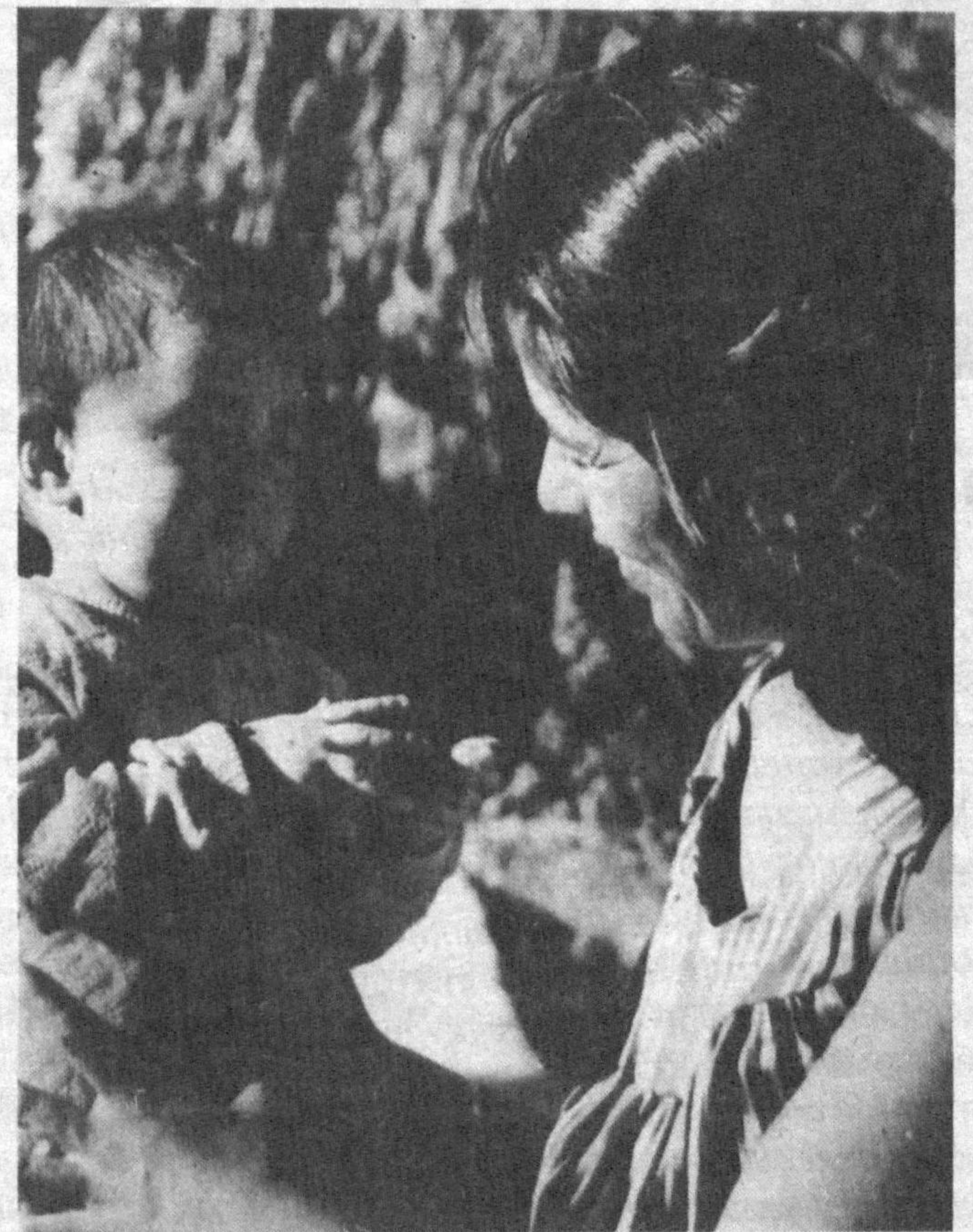
Талпиниб ўсаркан бола қўйишга Нафасин бўғмасин бурқсиган тутун. Одамлар, болани кўтаринг бошга, Бола бор уй гушан, бағримиз бутун!

Авваламбор Торобий бобомизнинг уйғоқ руҳлари, табаррук нафаслари уфуриб турган