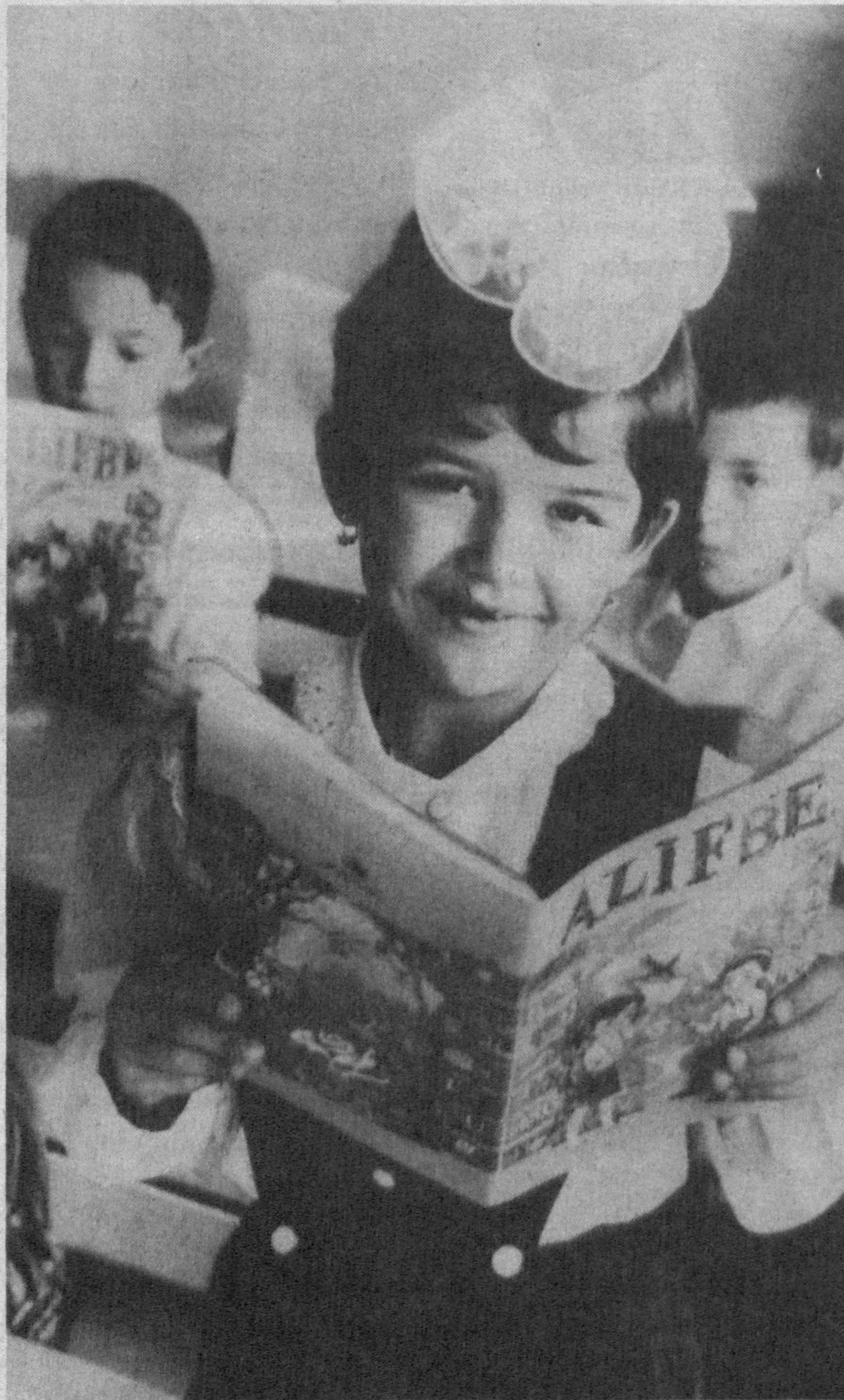
Алифбони энди мен Ҳеч қийналмай ўқийман

Мен туманлар уртасида ҳамшиша голиб деб топиладиган бир мактабни билардим. Шу мактабга узоқ яқиндан машҳур кишилар ташриф буюриб туришарди. Эсимда, уша куни тунни билан ёққан ёмғир эр-