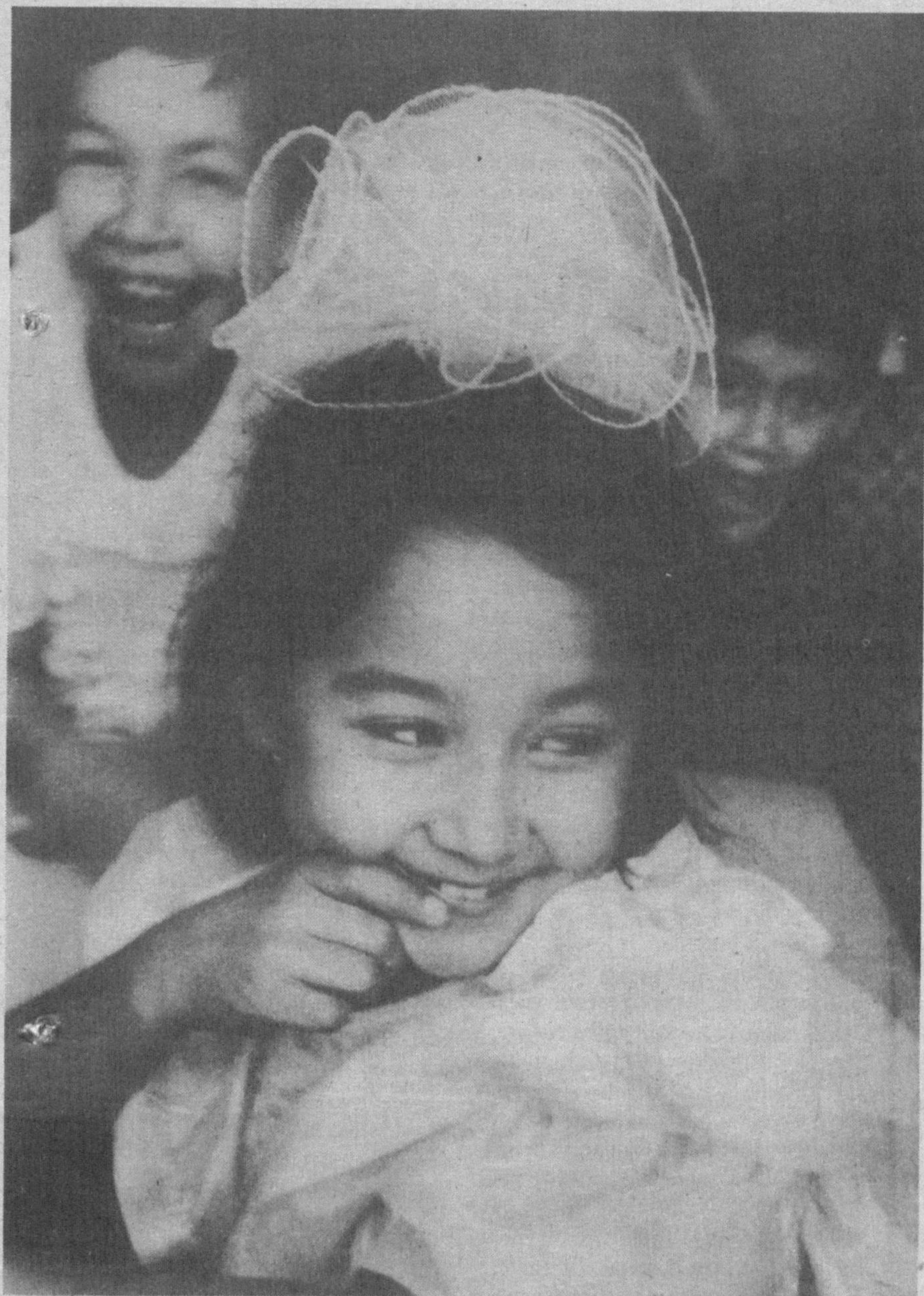
1-синфининг биринчи таътилида мазза қилиб дам оламиз.