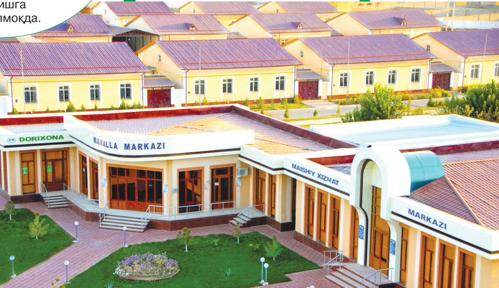
Жорий йилнинг 9 ойи якунларига кўра, мамлакатимизда