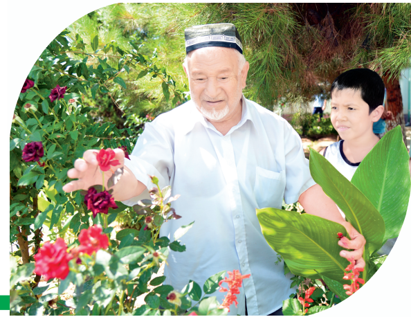
байрамни қариндош-уруғларимиз, кўни-қўшнилари билан биргаликда нишонлади. Шундай шоду хуррамлик маҳалламиздаги 16 та хонадон соҳибларига ҳам насиб этди.