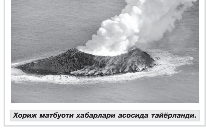
Хориж матбуоти хабарлари асосида тайёрланди.