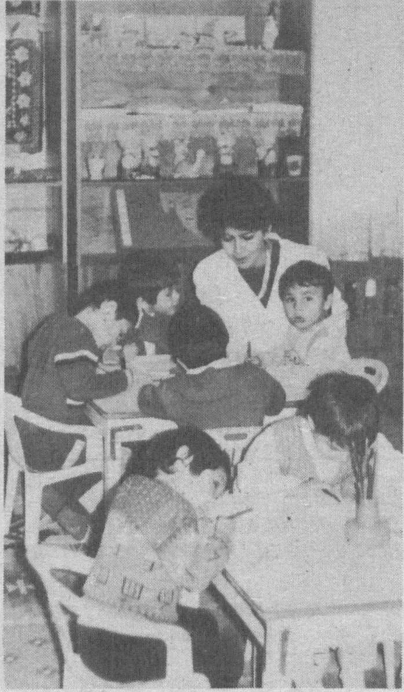
Хур Ватан сеники, Тонглар сеники!

Болажон! Орзуларингнинг губори йуқ. Далажонимга ухшаб, милиционер буламан деганингни эшитиб орзикиб кетдим ва